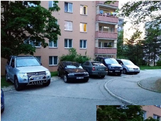
Obrázky 7 a 8