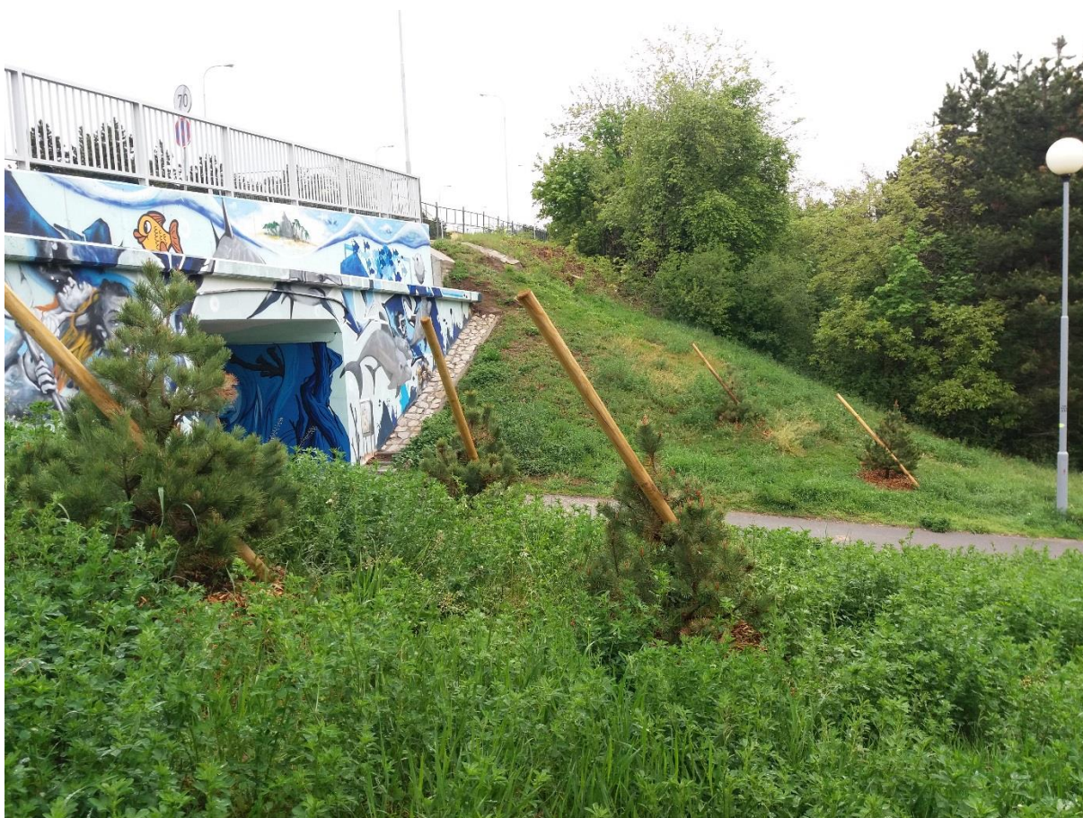
foto č. 8: zeleň vedle podchodu u autobusové zastávky Bartákova (ze strany Josefy Faimonové)