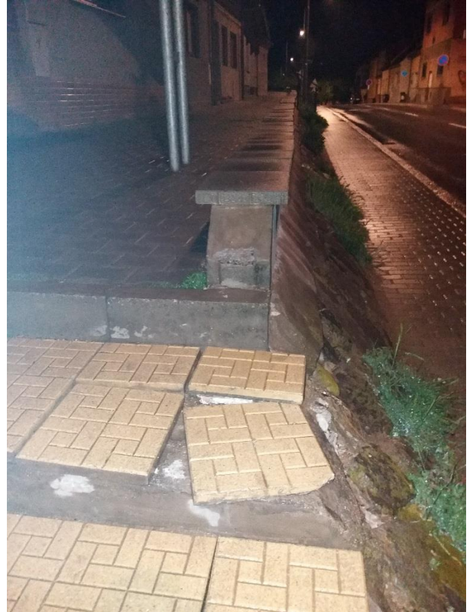
foto č. 3 a 4: Šimáčkova 21 – závady na chodníku a přilehlé zídce