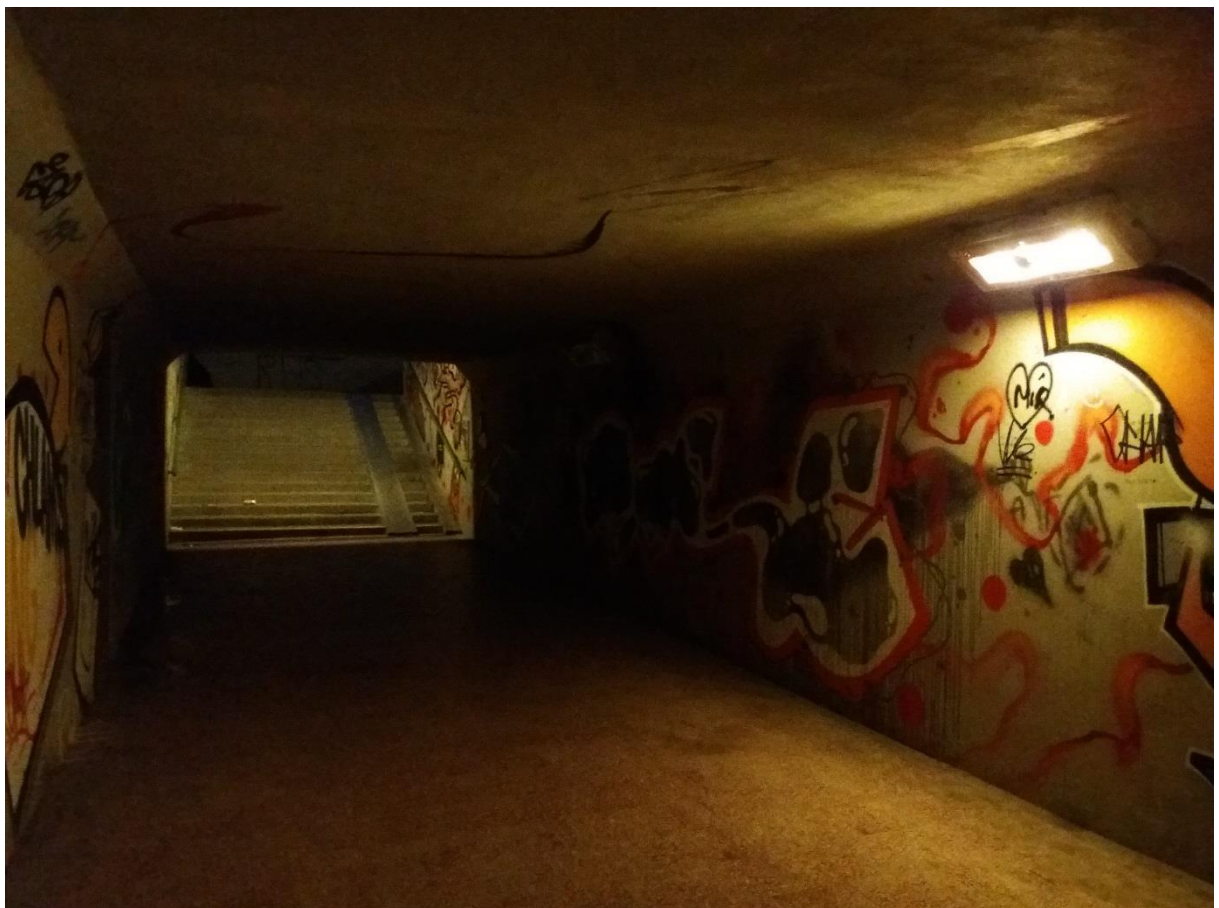
Obrázek 6 (podchod u ZŠ Novolíšeňská)