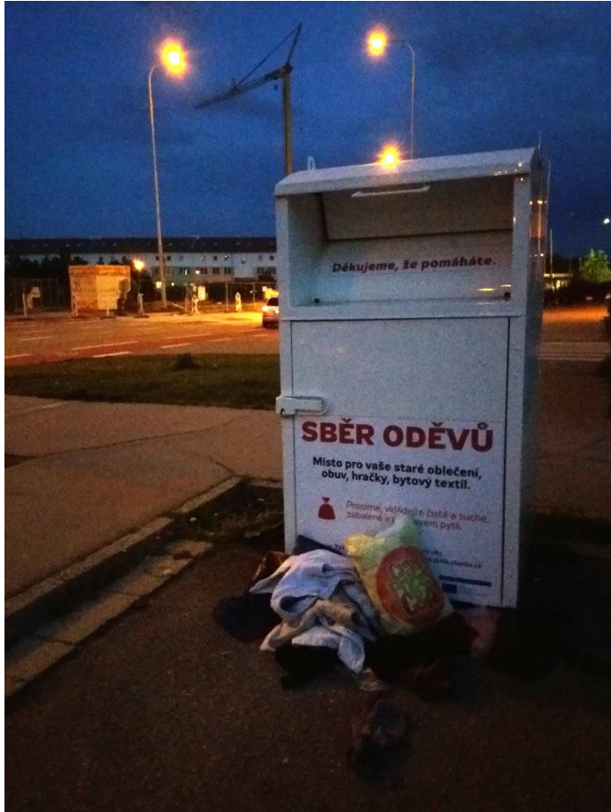
Obrázek 5 (poblíž smyčky MHD Jírova u ulice Novolíšeňská)