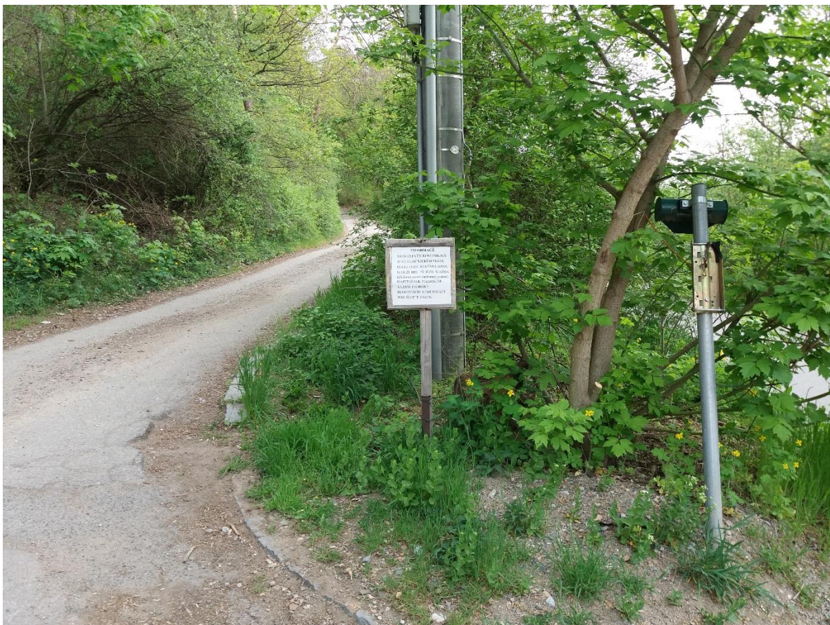
Obrázek 8 (nad místem z předchozího obrázku)