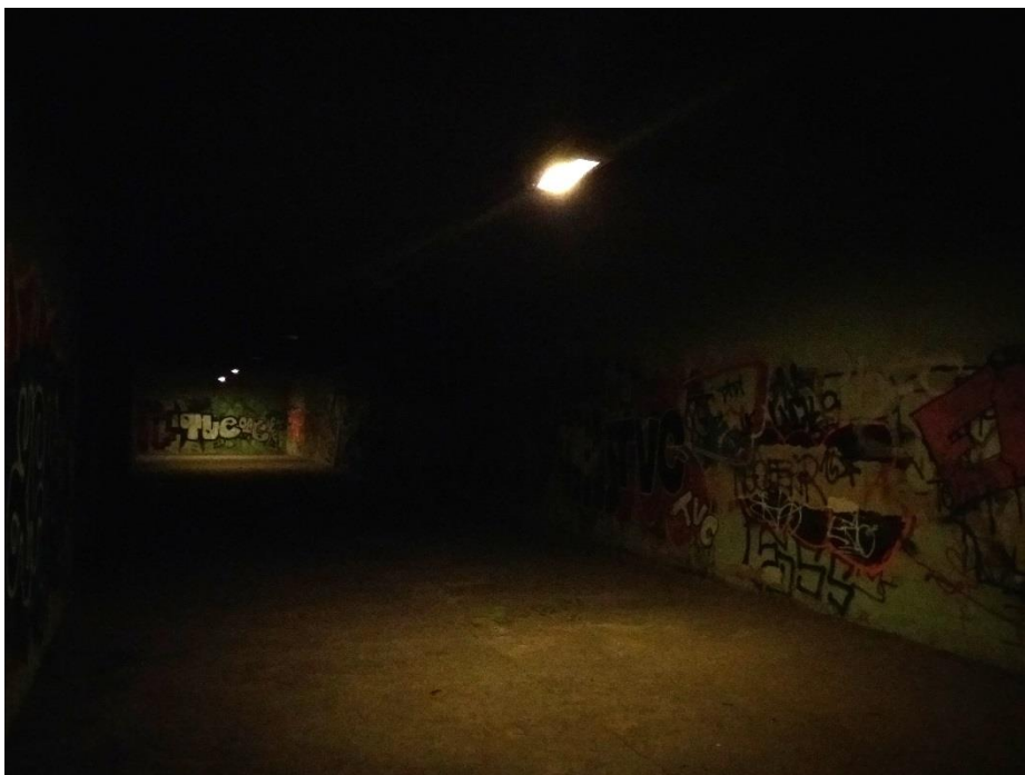
Obrázky 2-4 (osvětlení podchodu pod ul. Jedovnická)