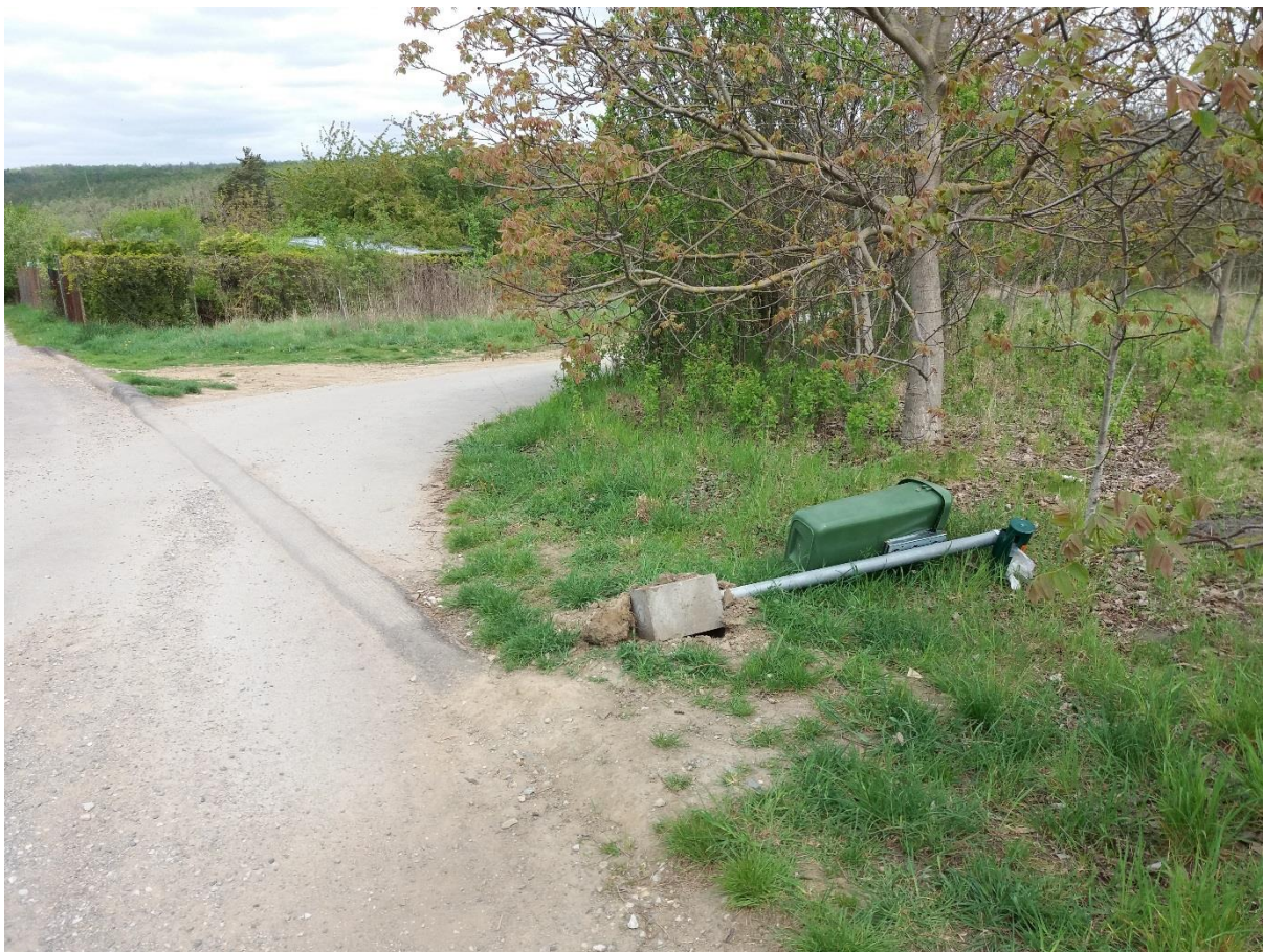
Obrázek 9 (rozcestí mezi Kostelíčkem – ne ulicí, ale kapličkou a cestou k ulici Podlesná)