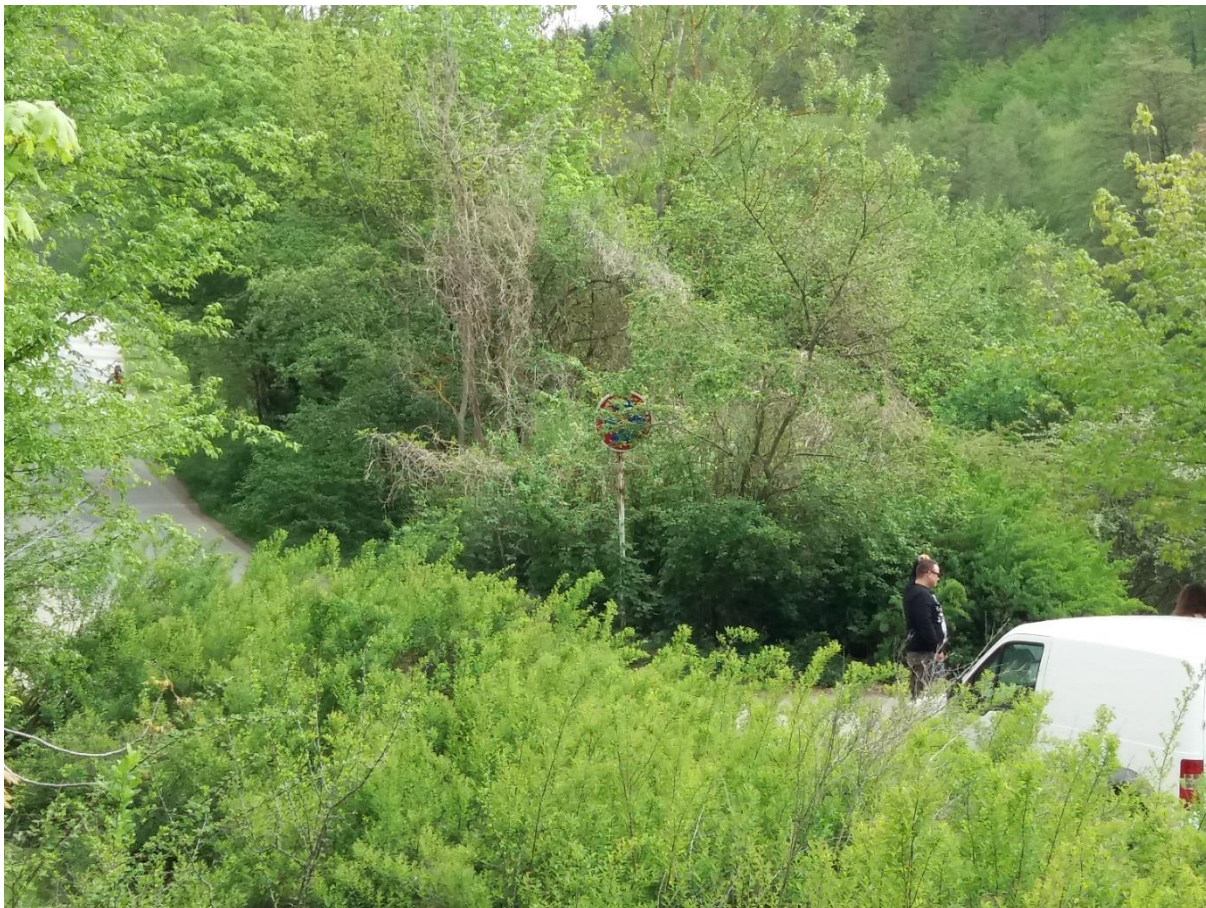
Obrázek 7 (začátek komunikace do Mariánského údolí)