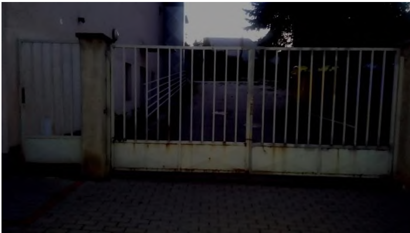
Obrázek 7 a 8: kontrola vstupu do areálu Dělnického domu v Klajdovské ulici