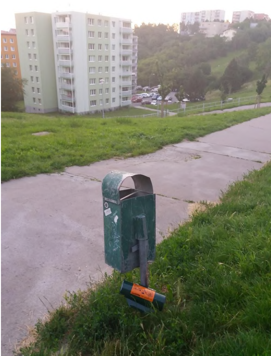
Obrázek 2: poškozený odpadkový koš (mezi resaurací Na Vyhlídce a Ochozskou č. 36)