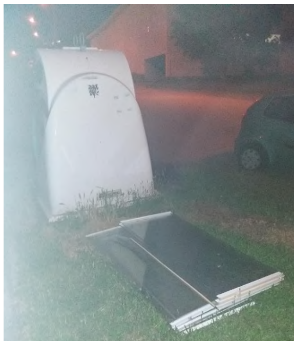
Obrázek 15: Hubrova č. 1 – stará okna na trávě vedle kontejneru na sklo