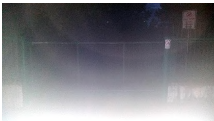
Obrázek 13: kontrola brány ZŠ Novolíšeňská a okolí