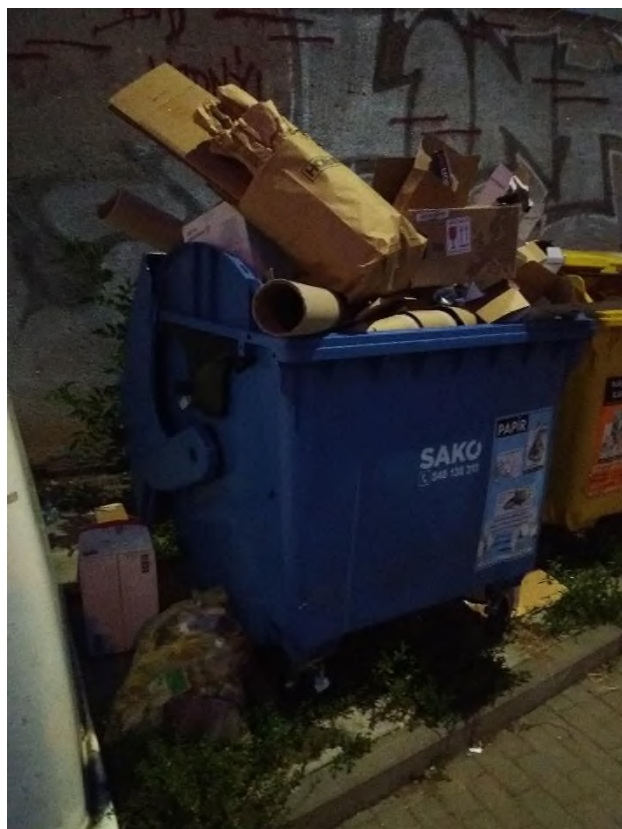
Obrázek 12: přeplněný kontejner a odpad uložený mimo něj - nám. Karla IV. č. 17