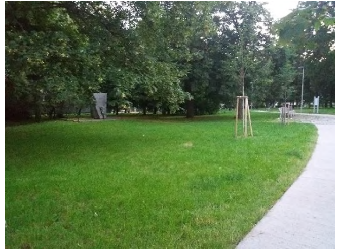
Obrázek 5 a 6: kontrola parku na ulici Trnkova