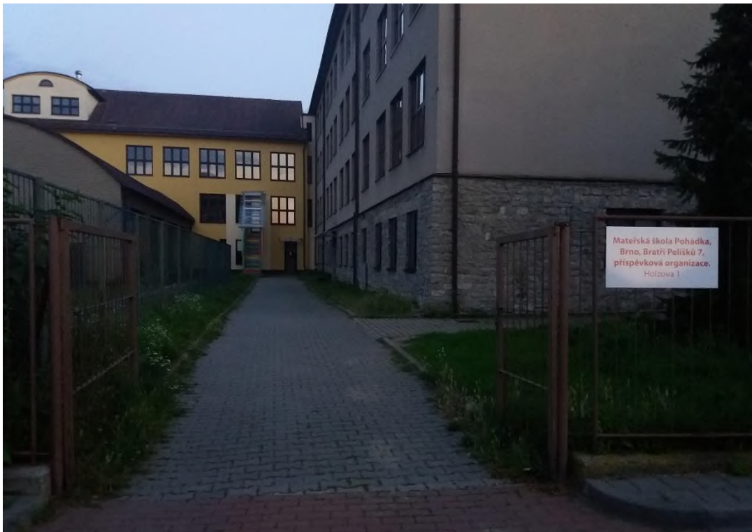
Obrázek 4: ZŠ Holzova - otevřená brána ze strany ulice Kučerova