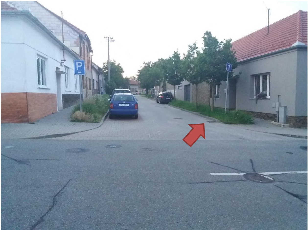
Obrázek 3: nakloněná dopravní značka označující jednosměrný provoz (křižovatka ulic K. Světlé a Fučíkova)