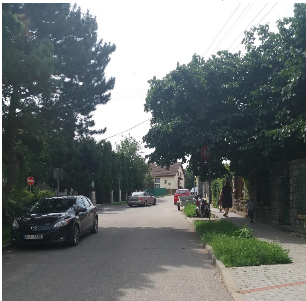
Obrázek 16: částečně zakrytá dopravní značka zákaz odbočení – křižovatka ulice Breitcetlova a Štítného