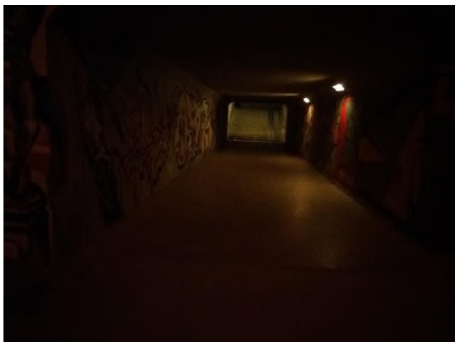
Obrázek 14: kontrola podchodu mezi ZŠ Novolíšeňská a Rotreklovou