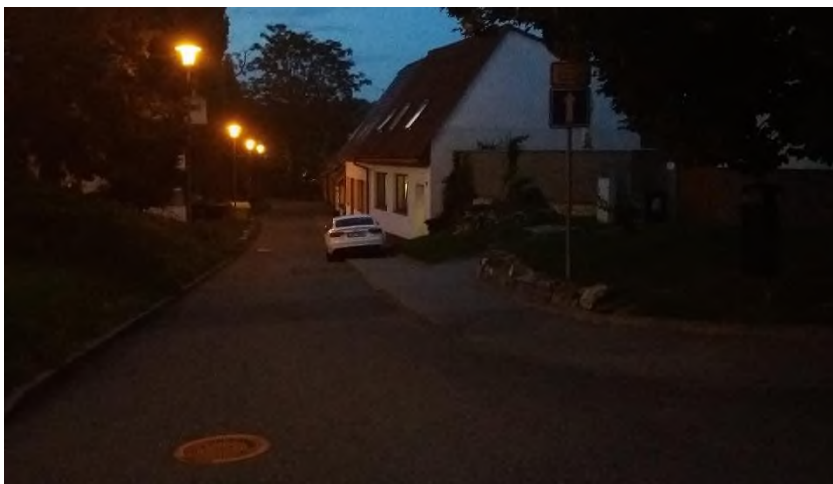
Obrázek 10 a 11: větvi zakrytá dopravní značka zákaz vjezdu - nám. Karla IV. č. 27