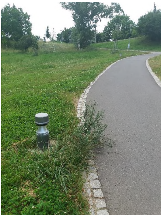
Obrázek 17: líšeňská rokle vedle tram. zastávky Masarova - jediná lampa bez průhledného krytu, ostatní v pořádku