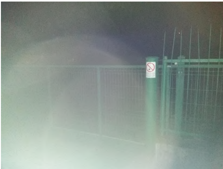
Obrázek 16: kontrola areálu a okolí ZŠ Novolíšeňská