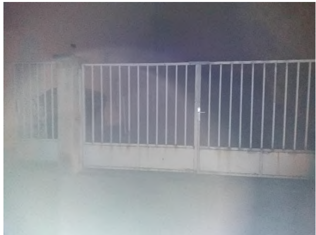
Obrázek 3 a 4: kontrola vstupů do areálu Dělnického domu z ulice Klajdovská a Martina Kříže