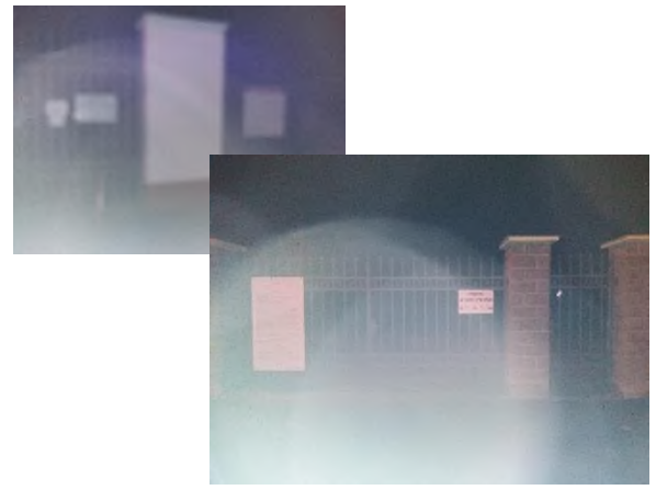
Obrázek 10 a 11: kontrola hřitovných branek