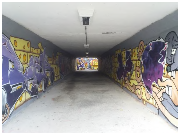
Obrázek 17: kontrola podchodu mezi Horníkovou a Rovnoběžnou