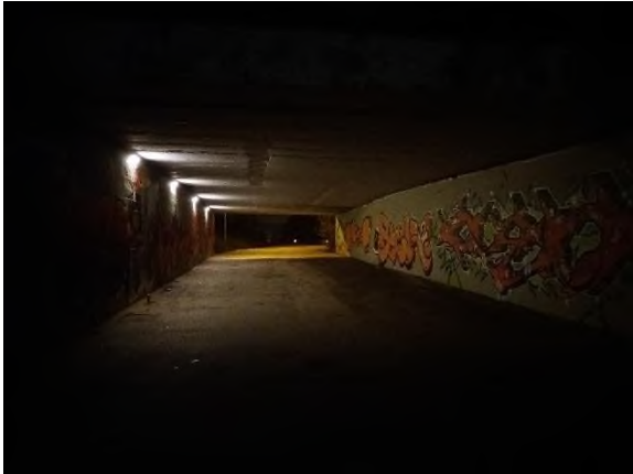
Obrázek 1: kontrola podchodu pod dolní částí ulice Novolíšeňská (směrem k Trnkové)