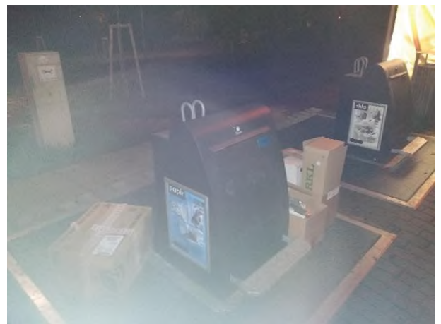
Obrázek 5 a 6: nevhazený nadměrný odpad okolo podzemních kontejnerů na Trnkové ulici