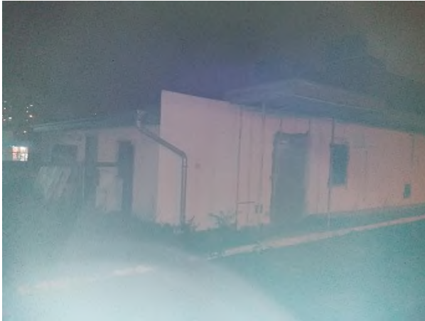
Obrázek 7: kontrola objektu bývalého Mc Donaldu