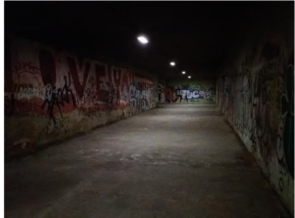
Obrázek 2: kontrola podchodu pod dolní částí ulice Jedovnická (směrem k Vinohradům)