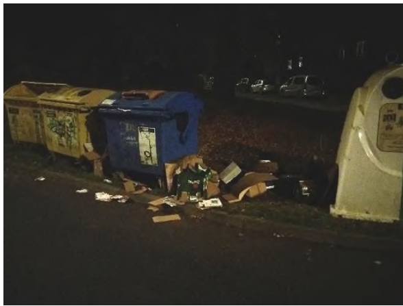
Obrázek 9: Obecká 2 – odpad poházený mimo kontejnerové nádoby