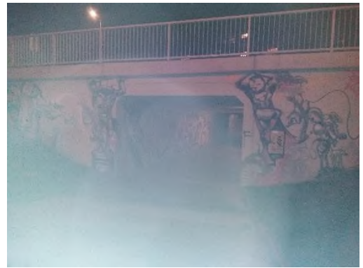
Obrázek 14 a 15: kontrola podchodů u J. Faimonové a ZŠ Novolíšeňská