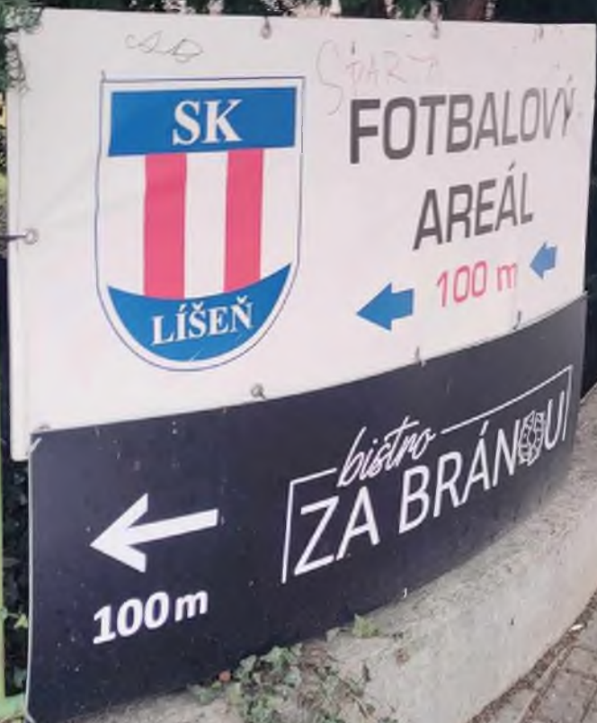
Holzova, před budovou školy