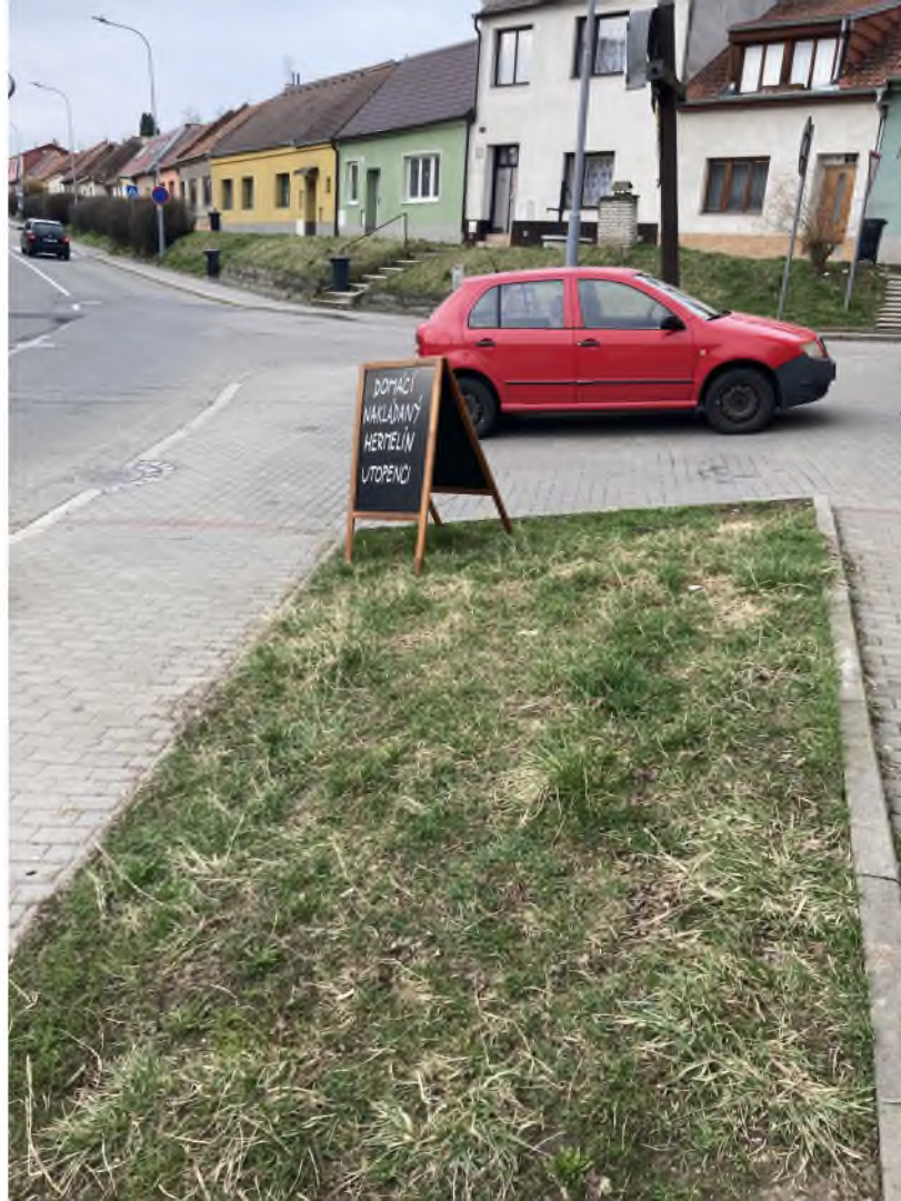
Šimáčkova u Marketu