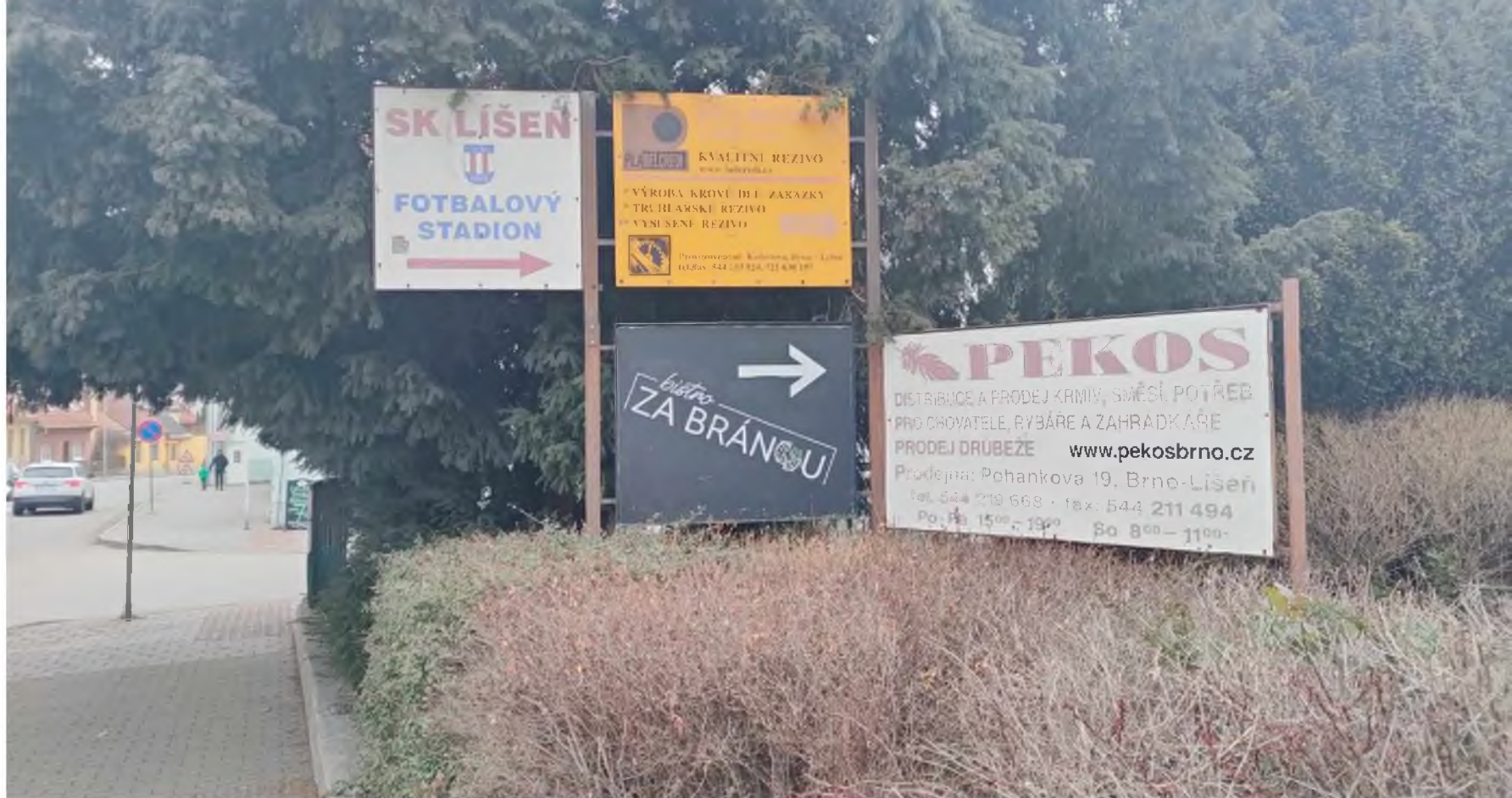
Holzova, před budovou školy