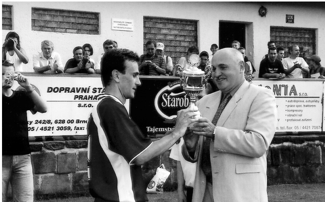
Pohár za vítězství v krajském fotbalovém přeboru předává kapitánovi mužstva I. místopředseda ČMFS a předseda JmKFS Ing. Mokry.

Je potřeba poděkovat všem dobrovolným pracovníkům, je jich minimálně 50. Jsou to třeba někteří tatínci malých hráčů, dále spousta starších pánů jako pořadatelé, kteří nám pomáhají. Jsou to lidé, kteří to dělají zdarma, mnohdy ještě sami finančně přispívají. Další takovou skupinou jsou sponzoři, kteří různým způsobem pomáhají, bez toho by fotbal nemohl být. Je také třeba poděkovat panu starostovi a paní místostarostce, ale i celému vedení radnice za to, že líšeňský fotbal vnímají ne jako tok peněz do fotbalistů, ale jako šanci pro děti, které místo toho, aby se toulaly po sídlišti, jsou na hřišti, kde se o ně někdo smysluplně stará. J.P.