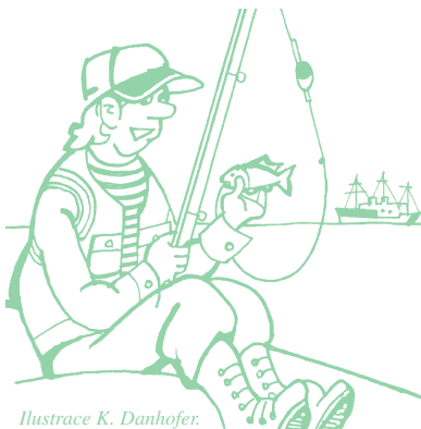
Ilustrace K. Danhofer.