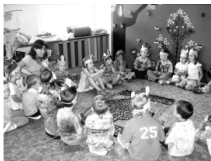
Indiáni na příměstském táboře.

Do našich kurzů je možno se hlásit osobně, e-mailem nebo telefonicky na č. 725 816 804.