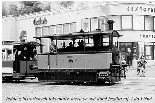
Jedna z historických lokomotiv, která ve své době jezdila mj. i do Líšně.

V říjnu roku 1964 byl zastaven provoz na trati do Líšně. Jednalo se o dosud nejdelší zrušený úsek. Důvodem zrušení byla zřejmě nedostatečná obslužnost Líšně tramvajovou dopravou vzhledem k nemožnosti jejího prodloužení a špatný technický stav trati. Prepravní zátěž s větším pohod-