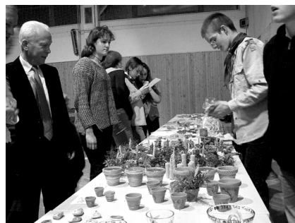
Skauti nabízejí své výrobky.

Věříme, že přítomní diváci byli spokojeni, a že se s nimi setkáme při dalších akcích pořádaných Nadací pro radost.