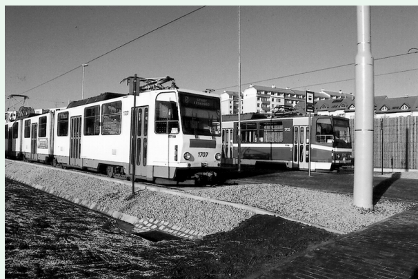
Nově vybudovaný úsek prodloužil tramvajovou trať o 430 m. Součástí stavby je i protihluková stěna z dřevěných panelů v délce 101 m a výšce 4 m, chodník, komunikace pro pěší a zastávka autobusů.