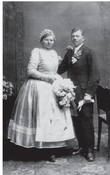
Svatební fotografie líšeňských svatebčanů z 1. čtvrtiny 20. stol.

Vodpoledňa sendó se drožbe, drožičke a mozekanti k nevěstě. Drožbe a drožičke dó s mozekó pro „hřebece“ k tetičce (hospodyně), kerá je darovala. Nekerá přibozná hospodeň hopenče několik velkých bochet, „bábuvek“, sva-