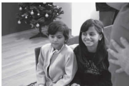
Takto nás děti přivítaly ve svém dočasném domově.