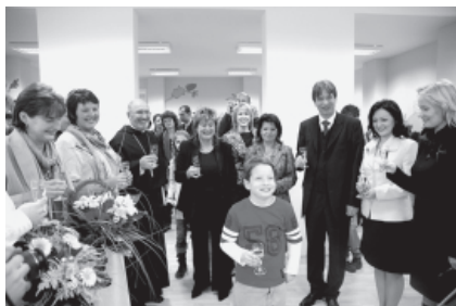
Bez společného přípitku „Rychlími špunty“ se tato sláva nemohla obejít.