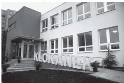
Nově upravená budova bývalé mateřské školky na Michalově ulici.

V čase těsně před vánočními svátky bylo v Líšni na Michalově ulici slavnostně otevřeno první jihomoravské zařízení Fondu ohrožených dětí – Klokánek. Fond byl založen roku 1990 a jeho cílem je pomáhat dětem sociálně ohroženým, opuštěným a týraným. Klokánek v Líšni, stejně jako ostatní zařízení tohoto typu v celé republice, má jednu nespornou výhodu – jeho pomoc je okamžitá. Klokánek má nepřetržitý provoz, proto může kdykoliv přijmout nejen větší děti, ale i novorozence a poskytnout jim potřebnou péči. V 11 bytech první kategorie může nalézt krátkodobé, ale i dlouhodobější útočiště až 42 dětí. K budově patří také velká zahrada s nově upraveným hřištěm. Zařízení zabezpečuje dětem i školní docházku, stejně jako mimoškolní aktivity a zájmovou činnost. (J.P.)