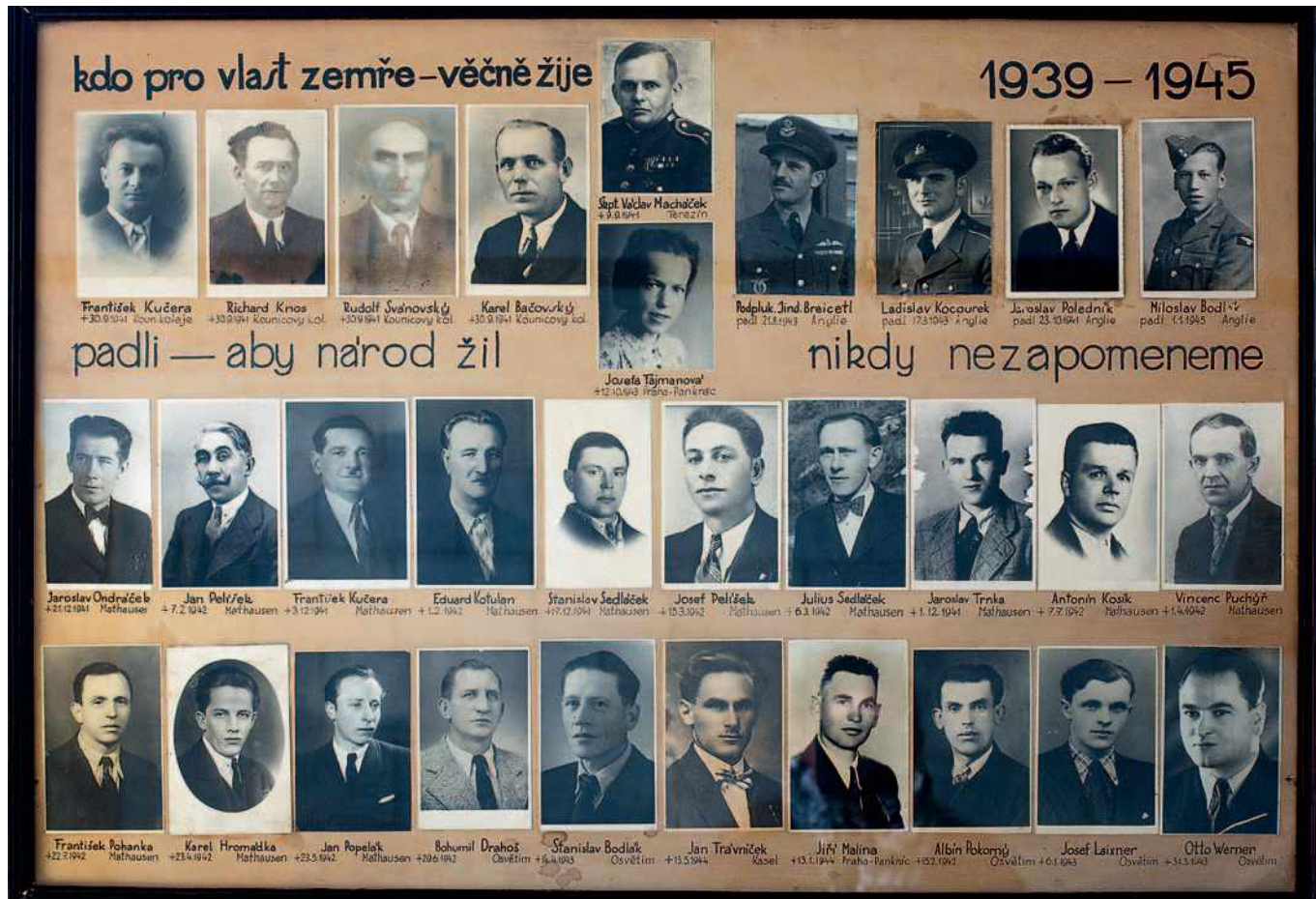
Pamětní tabule umístěná u vchodu ZŠ Holzova