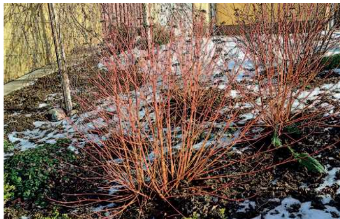
Keře s barevnou kůrou jsou nejkrásnější, když se řežou až pozdě na jaře

Při odřezávání větví doporučuji, aby se co nejméně odřezávaly větve s průměrem větším jak 10 cm. Velké rány se špatně hojí a zaceľují a jsou bránou houbovým či bakteriálním infekcím. Při řezu nikdy nezanecháváme pahýly a čípkky. Řez provedeme nejlépe v místech nejtěsněji u větve či kmene nebo v místech větevního kroužku. Nikdy nepřipustíme vylomení větve. Proto větší větve řežeme alespoň na dvakrát.