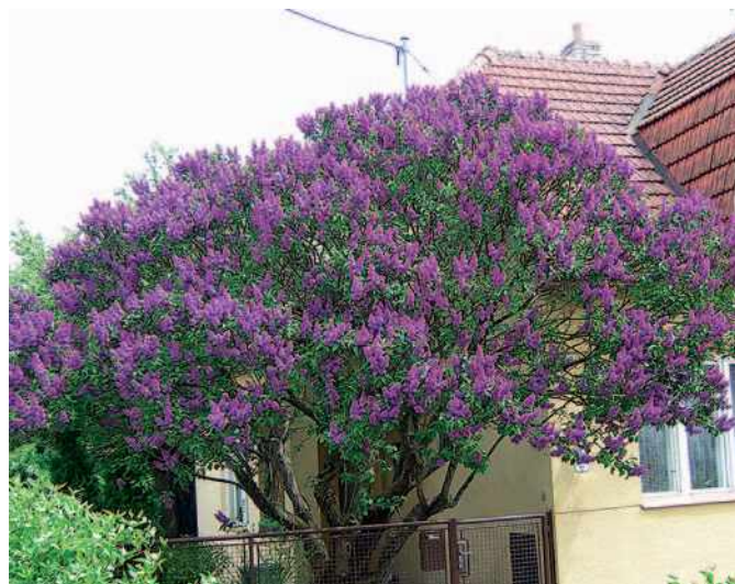
Dlouhodobě neřezaná šeřík se odvděčí množstvím květů

Řezné rány vždy ošetříme štěpařským voskem nebo balzámem, který obsahuje inhibiční látky a fytoncidy, případně vosky, které zabraňují vysychání rány. Nikdy nepoužíváme Luxol a podobné přípravky používané na konzervaci mrtvého dřeva. Také barvy nejsou vhodné.