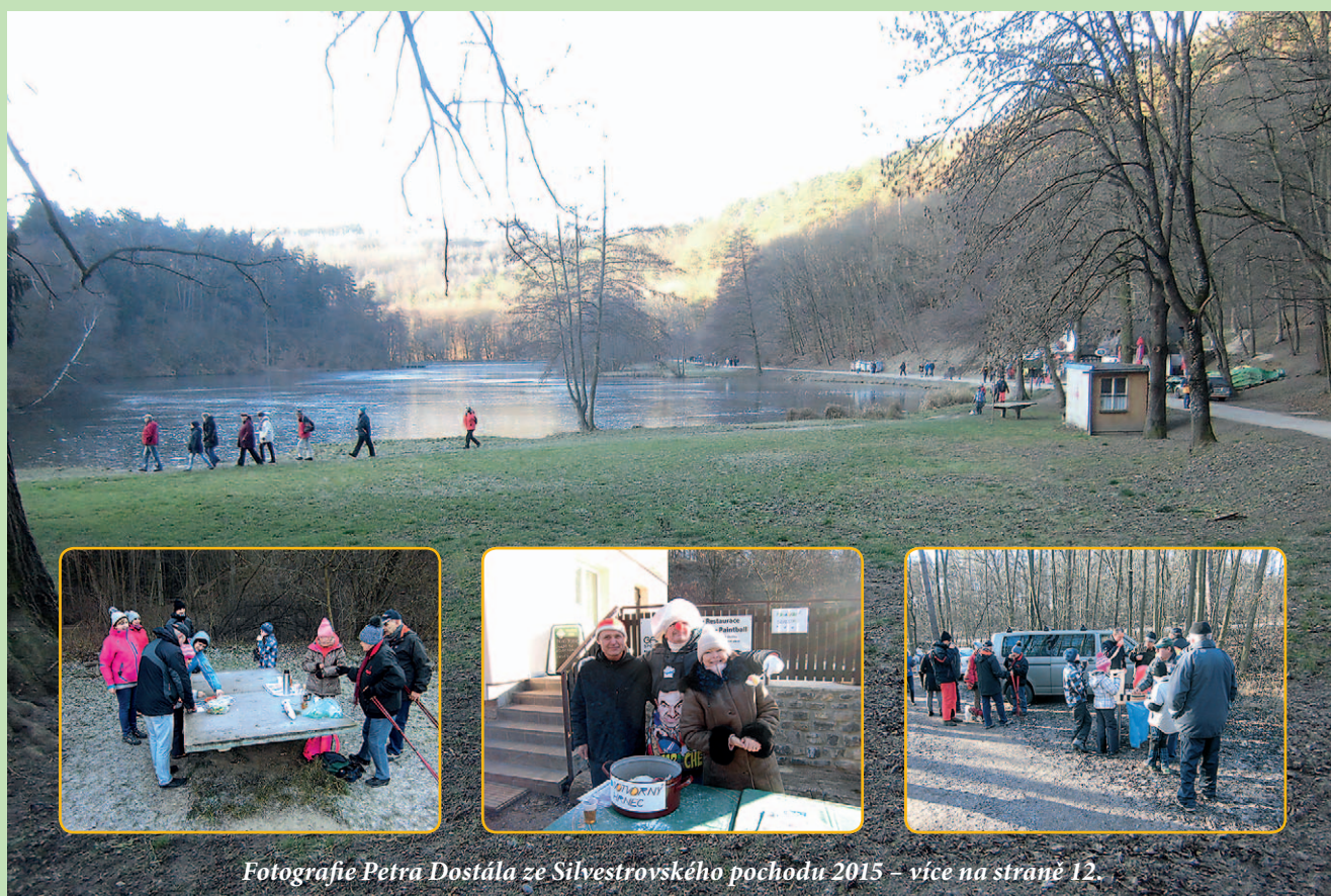
Fotografie Petra Dostála ze Silvestrovského pochodu 2015 – více na straně 12.