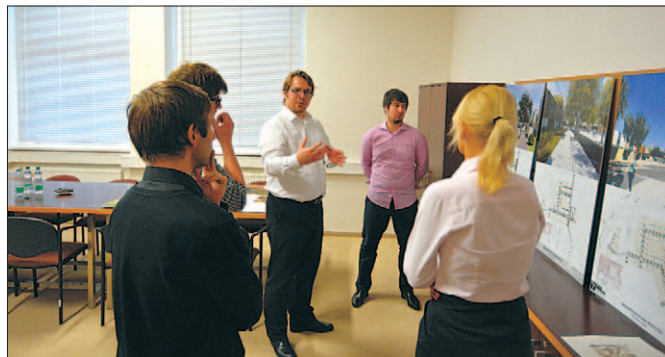
Snímek z prezentace studentských prací.