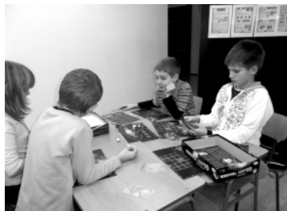
Soustředění hráči na vánočním turnaji

Počítač se neusměje, ani se nedokáže zdravě naštvat. A v tom spočívá kouzlo deskových her. V rámci projektu tzv. „otevřených škol“ tak vznikly herní kluby na školách v celé republice a jejich činnost je podporována ze strany školských orgánů.