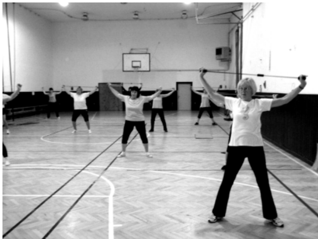
Tak se cvičí v oddílu „Cvičení pro ženy“ (sokolovna, čtvrtek 17. 45–19.00 h)

V mezi- a poválečném období je všestrannost spojena především s dovedností na tělocvičném nářadí a s nácvikem prostných na sokolské slety, resp. později s nácvikem skladeb na spartakiády. V druhé polovině 20. století opouštějí muži postupně programy všestrannosti a přecházejí k soutěžním sportům. Dnes je tradiční sokolská všestrannost, moderně uchopena, pěstována v Líšni pouze ženami.