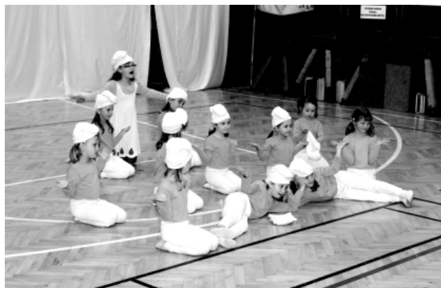
A je to. Taneční skupina Střevíčky I v závěru svého vystoupení „Šmoulata“ na akademii v dubnu 2011.