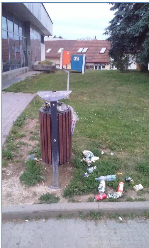
obr. 3: přeplněný koš u autobusové zastávky vedle samoobsluhy na nám. Karla IV a