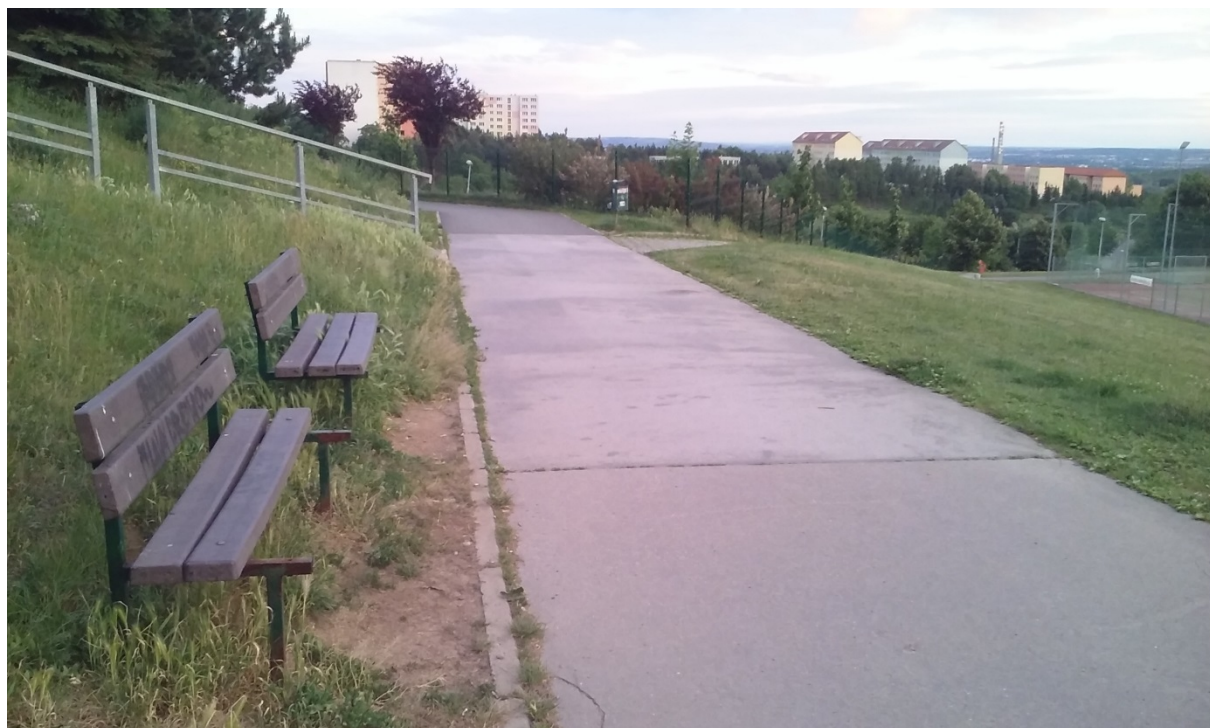
obr. 5: lavička s chybějící deskou pod ul. Jírova 23