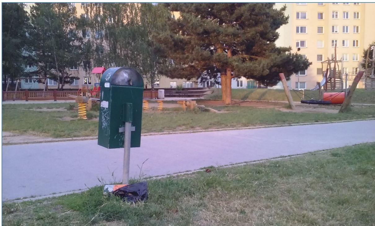
obr. 4: koš s uvolněným držákem na sáčky u dětského hřiště na ul. Jírova