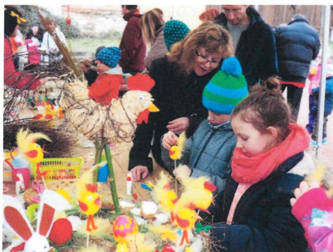
Líšeňské Velikonoce, rok 2019