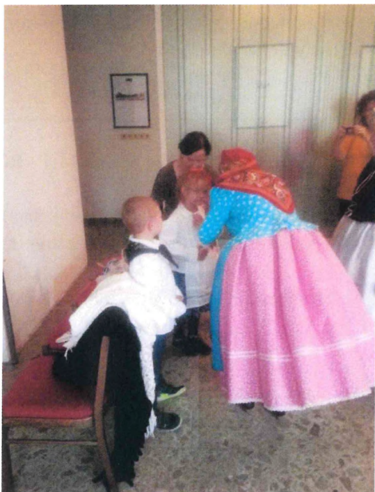
Tradice dětem, rok 2019

Vzhledem k tomu, že školička působí v budově Kotlanka, seniorky pro děti tvořily v rukodělných dílničkách a tedy ze školky mají o další spolupráci zájem, její forma zatím nebyla diskutována.