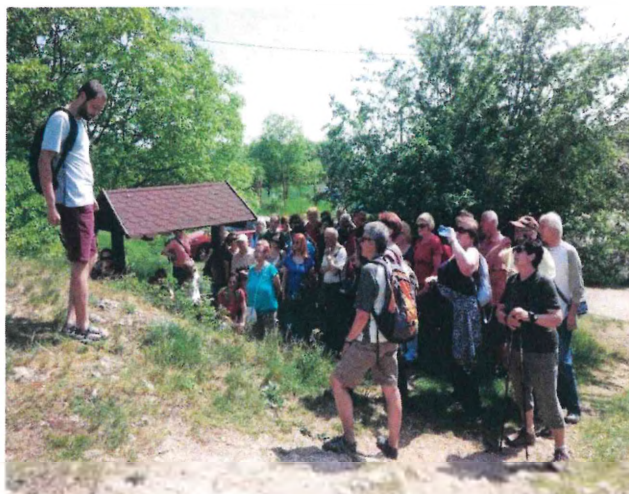
Procházka na Stránskou skálu, rok 2019