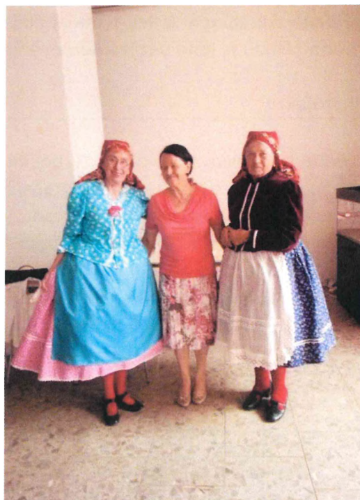
Hlavní tanečnice a švadlena kroje