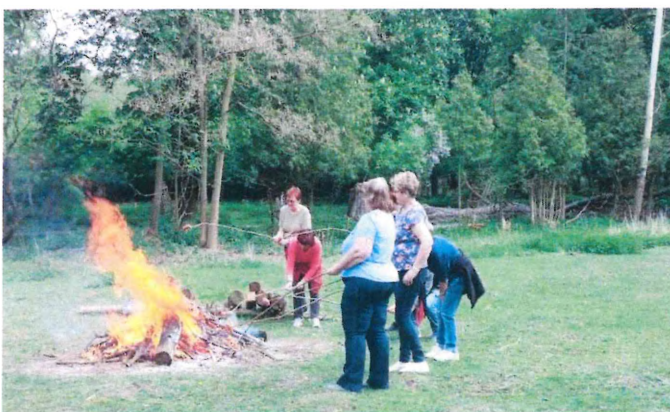
Procházka v Arboretu Sokolnice, rok 2019

Pro září je připravena procházka pro brněnských kavárnách dob minulých. Pro měsíc říjen je v jednání procházka v arboretu s lední pedagogikou MENDELU . Pro Advent procházka pro brněnských betlémech ve spolupráci s TIC Brno. Předpokládané náklady 2.000 Kč na obě akce.