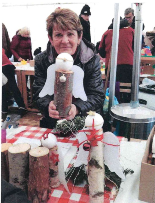
Líšeňské Vánoce, rok 2019

Dílničky v sobě nesou velký potenciál pro mezigenerační aktivity, např. seniorky mohou předávat své znalosti v ručních pracích mladší generaci.