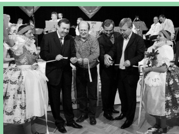
Slavnostním přestřizem pásky se završila dlouholetá snaha MČ Brno-Líšeň o rekonstrukci Dělnického domu, který se tak stává důstojným stánkem kultury a společenského života v Líšni (více na str. 7).

V oblasti veřejné správy, majetku, financí a hospodaření bylo rovněž vykonáno mnoho práce. Zkvalitnili jsme správu svěřeného majetku, snažíme se v rámci našich finančních možností udržovat svěřený majetek v dobrém stavu, nepřipustili jsme další zadlužování městské části, udrželi jsme vyrovnanost rozpočtu v uplynu-