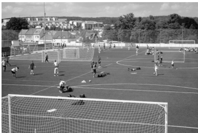
Celkový pohled na fotbalové hřiště.