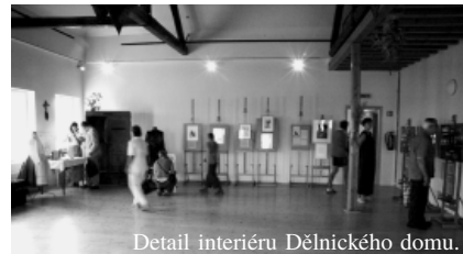
Detail interiéru Dělnického domu.