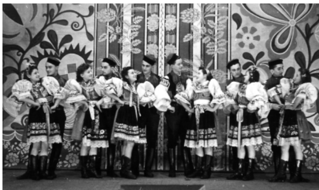
Představení „Děti Slovače“ (Dělnický dům 1941).

Snad tím nejvzrušivějším vynálezem 19. století byla fotografie, správněji dagerrotypie nazvaná po francouzském vynálezci Louis J. M. Daguerrovi. Zveřejnění tohoto převratného vynálezu se stalo na společném zasedání francouzské akademie věd a krásných umění v Institut de France dne 19. 8. 1839. A tak je tento den považován za den zrození fotografie. Po zveřejnění tohoto vynálezu zvolal francouzský malíř Paul Delaroche: „Od nynějška je malířství mrtvé!“. Tento historicky neověřený výrok však dokumentoval obavy všech umělců – malířů z nového způsobu zobrazování, které se již tehdy dávalo do souvislosti s výtvarným uměním.