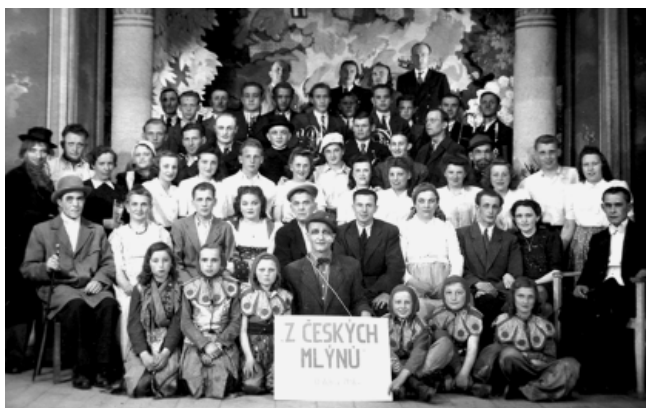
Líšeňský divadelní soubor v roce 1945.

Celý předlouhý vývoj divadelního umění nese ve své morfologii odraz vývoje lidského rodu. Má i své mýtické božské kořeny, které mu propůjčovalo dojem jakéhosi vyššího poslání. Vznešenost tohoto božského původu divadla pocítíme vždy, když vstupujeme do divadelních sálů s „čistým srdcem a duší plnou citu“. To je ono dávné poselství řeckého boha vína Dionýsa, který nám předává, s radostným voláním své družiny „EVOI“, umění, které přetrvalo věky. Od zrození božského Homéra, největšího řeckého básníka, tvůrce dvou velkých eposů Ilias a Odyssey, uplynulo více jak 2000 let a přesto je neodmyslitelně spjata s dramatickým uměním dneška. Jistě mi laskavý čtenář promine, když se na tomto místě přenesu o několik století dále, opět do století devatenáctého k důležitým událostem českého divadla. Jména Václav Kliment Klicpera (1792–1859) a Josef Kajetán Tyl (1808–1856) představují důležité opěrné body při složitém zrození českého divadla, a která se také prolínají českou dramatickou tvorbou až do dnešní doby. Vyvrcholením snah o české divadlo se stává rok 1850, kdy byl ustaven Sbor pro zřízení Národního divadla. Silným impulzem pro celou českou kulturu však bylo položení jeho základních kamenů 16. května 1868. Projevilo se to i v nezapadlejších vesnicích zakládáním divadelních spolků a malých hereckých skupin.