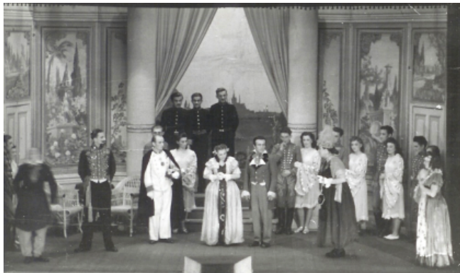
Představení „Polská Krev“ (Dělnický dům 1942).

A netrvalo to tak dlouho a objevil se další, ještě převratnější vynález: 28. 12. 1895, po 56 letech se na pařížském bulváru Kapucínů konalo v Grand Café první filmové představení lumierova kinematografu (amer. biografu). To se poprvé opravdu silně zatřásly sloupy divadla. A když v roce 1929, do té doby němý film promluvil – v prvním „stoprocentně zvukovém a mluvícím filmu“ Světla v New Yorku, bylo jasné, že divadlu vyrostl velmi silný konkurent. Když se v domácnostech ještě o několik roků později rozkmitala stínítka televizních obrazovek chtělo se opět zvolat: „Od nynějška je divadlo mrtvé.“ Nestalo se, všechna, dnes již můžeme říci umění, od divadla přes fotografii, kinematografii až k televizi, našla společnou řeč a v úzké symbióze spolu „žijí“ ovlivňují se a také navzájem inspirují.