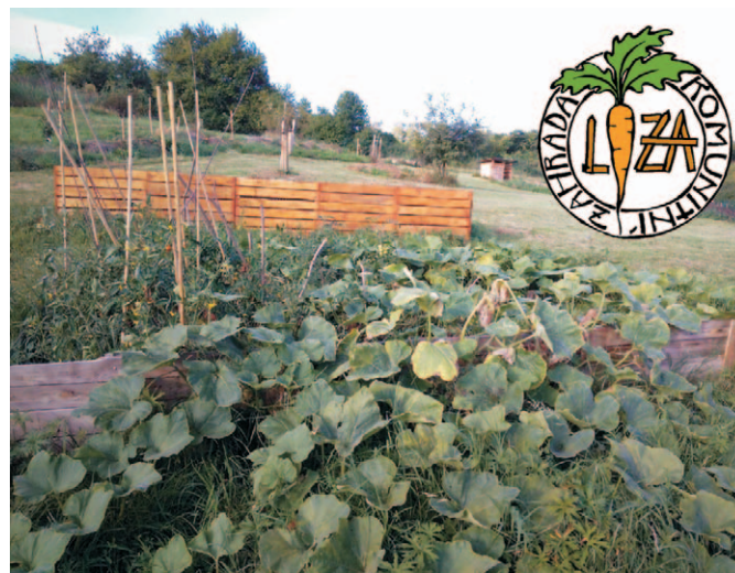
Zahradu provozuje Kavyl z.s., Viničné Šumice 137, IČ: 22909320

Na příští rok máme ještě pár volných záhonků, takže pokud i vy rádi zaboříte ruce do hlíny, dejte nám vědět na liza@lesnikvitek.cz .