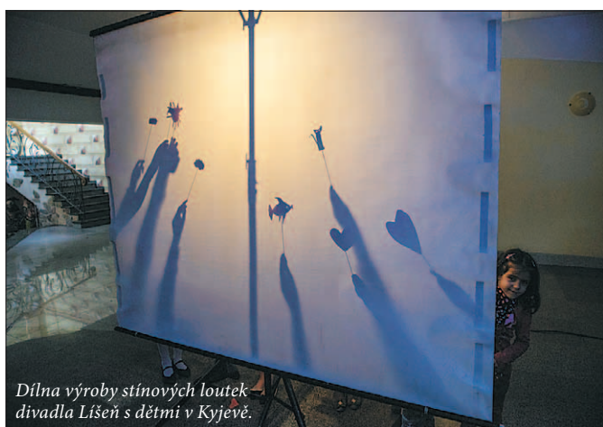
Dílna výroby stínových loutek divadla Líšeň s dětmi v Kyjevě.

Kromě Kyjeva účinkovalo divadlo Líšeň také ve Vinnyjci a Lvově a na jeho cestě po Ukrajině se podílely organizace České centrum Kyjev, Polský institut Kyjev a Ministerstvo zahraničních věcí ČR.