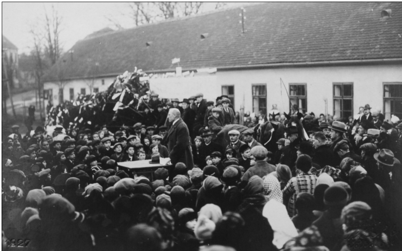
Rudolf Těsnohlídek při projevu v Líšni 7. 12. 1927, za ním ozdobený strom na voze