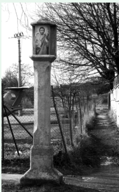
Mezi drobné památky patří kamenná Boží muka z roku 1725 stojící v dnešní Holzové ulici.

Druhá kapitola oddílu je nadepsána Historie budování areálu MHD v Líšni . Jeho autor Tomáš Kocman ji rozčlenil do čtyř částí, které postupně popisují kolekci historických vozidel městské hromadné dopravy nacházející se ve sbírce Technického muzea v Brně, bývalou tramvajovou trať mezi Stránskou skálou a Líšní, historická vozidla líšeňské dráhy a nakonec výstavbu líšeňského areálu MHD a deponování historických vozidel v něm. Kolekce historických vozidel brněnského Technického muzea vznikla roku 1971. Tehdy muzeum převzalo od Dopravního podniku města Brna dvanáct historických tramvají. Sbírkový fond byl postupně rozšiřo-