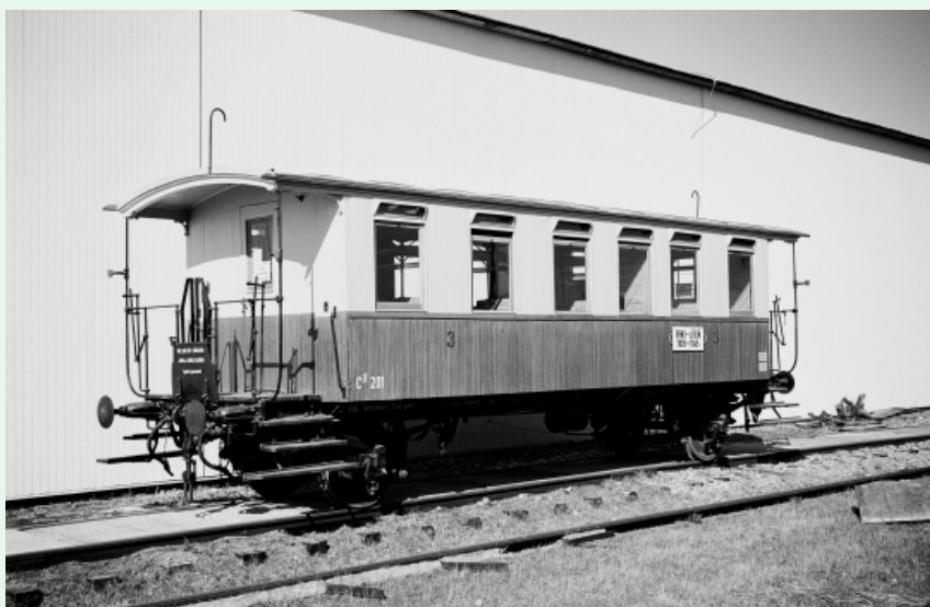
Osobní vůz řady Cíl 201 někdejší místní dráhy Brno – Líšeň. Je opatřen nátěrem z doby druhé světové války, kdy líšeňskou dráhu převzala Společnost brněnských elektrických pouličních drah, která zavedla barevné schéma odpovídající tehdejším tramvajím.