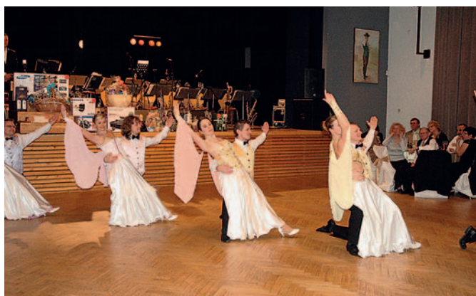
Ples Líšeňské radnice 2015