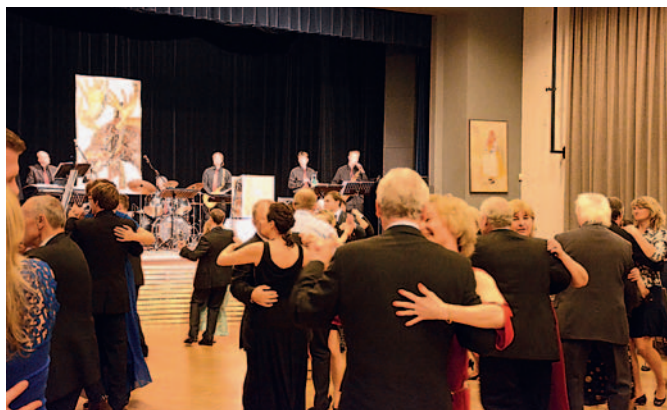
Ples LOS 2017