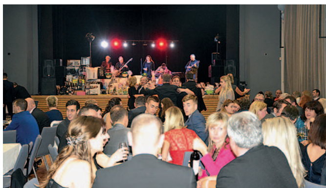
Ples SK Líšeň 2020