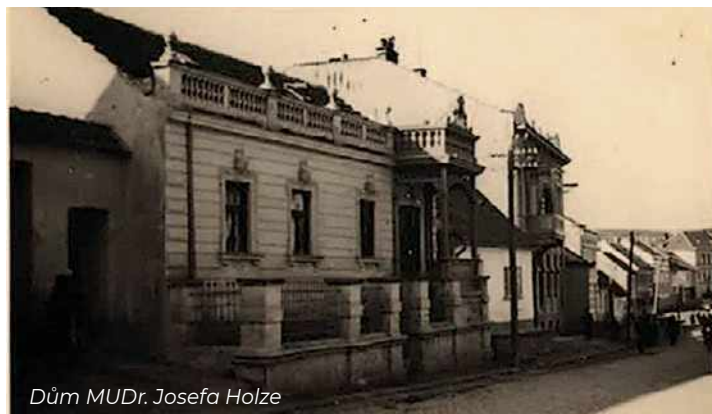
Dům MUDr. Josefa Holze