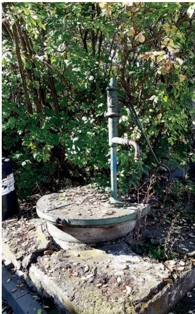
Podhorní 11, studna v havarijním stavu

Kompletní rekonstrukce jedné studny (výměna skruží, vyčištění studny, obsypání kačírkem, výměna čerpacího zařízení atd.) se pohybuje od 50 do 80.000 Kč. Pokud by se ale studna rušila (jak navrhuji u více než poloviny našich studní brněnské vodárny), tak to není odstranění čerpacího zařízení. Dle informací od pana Staňka (odbor životního prostředí MČ Líšeň): „Zakonzervování některých studní, tak, jak bylo v minulosti plánované, už stejně nebude možné, podle informací z OVLHZ by muselo jít o kompletní zrušení vodního díla (tedy včetně zasypání), nepovolili by pouze překrytí studny s izolací.“ Na tento postup by bylo potřeba také projekt a povolení odboru životního prostředí MmB.