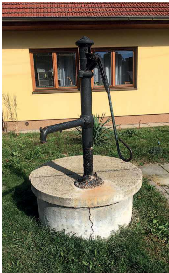
Ondráčkova 207, studna udržovaná místními

Belcrediho 1, Jateční 6, Klajdovská 24, Klicperova 12, Krameriova 3, Kubelíkova 53, Malečkova, Markovičova 20, Markovičova 45, M. Kříže 18, M. Kříže 34, Nám. Karla IV. 2, Ondráčkova 207, Ondráčkova 227, Podhorní 11, Podhorní 93, Salajní 13, Salajní 31, Střelnice 18, Šimáčkova 119, Šimáčkova 156, Šimáčkova 18, Šimáčkova 180, Šimáčkova 54, Šimáčkova 63, Štítěného 36, Velatická 1 (zrušena v rámci výstavby nové kanalizace), Zahradní 51.