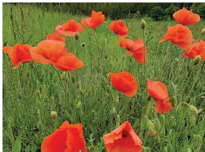
Mák vlčí ( Papaver rhoeas ).

Ocún není jen vizuálně zajímavým zvěstovatelem podzimu. Jde o nesmírně zajímavou bylinu z čeledi liliovitých, do které by jen málo kdo řekl, že její něžně fialový květ patří k těm největším, s jakými se v naší přírodě můžeme setkat. Ocún je vlastně drobná hlíza se zásobními látkami ukrytá hluboko v půdě. Aby prozářil traviny typickým růžovým akcentem svých barev, musí okvětní trubkou prorůst 5 až 15 cm půdy, nad kterou teprve rozvine dalších až 15 cm květu.