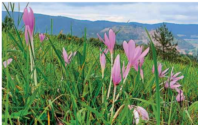
Ocún jesenní ( Colchicum autumnale ).

Jejich bílá rozvolněná okvěť umí rozprostřít jemný bělavý závoj nad celou travnatou plochou. Jedním z typických podzimních květů, se kterým jsme se prozatím v Rokli setkat nemohli, je ocún jesenní. Na sklonku léta se podařilo získat k transferu několik desítek hlíz této zajímavé rostliny a zachránit je z lokality, která pro existenci tohoto druhu zanikala. Jejich novým domovem se stanou luční svahy při vstupu do Rokle u zastávky Masarova. Příští rok zde