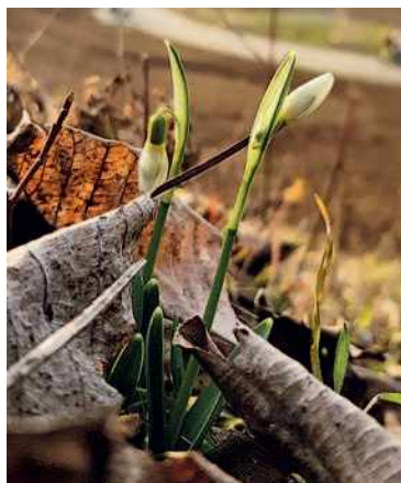
Rozkvétající sněžinka podsněžník ( Galanthus nivalis ).

V moři panelových domů zůstává údolí Rokle vyhledávaným zeleným ostrovem. Zvláště svahy mimo souvislé porosty dřevin zkrášlují květy mnoha druhů lučních bylin. Většinou jde o druhy tzv. přirozeného genofondu krajiny, tedy ty se kterými se setkáváme ve volné přírodě.