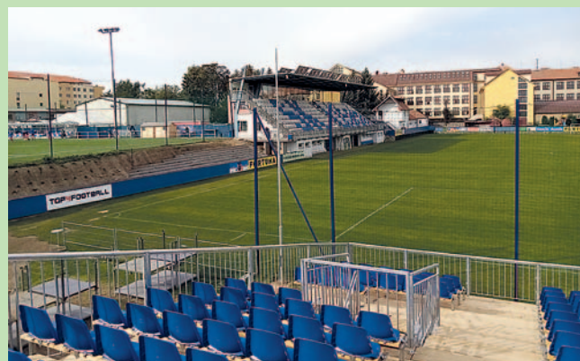
Pohled na ochoz pro stojící diváky z nové tribuny se sedadly pro 500 návštěvníků.