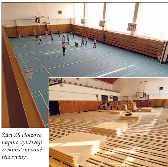
Žáci ZŠ Holzova naplno využívají zrekonstruované tělocvičny