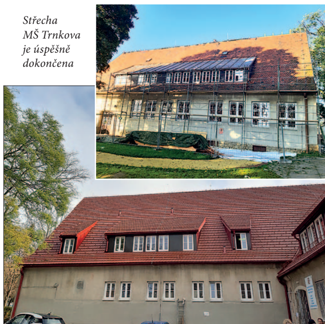
Střeška MŠ Trnkova je úspěšně dokončena