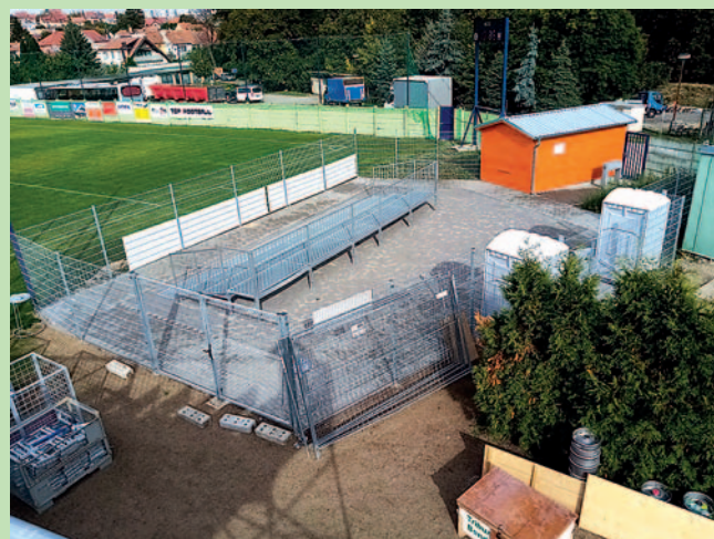
Nová tribuna pro hosty má i svůj vlastní vchod, toalety a bufet.