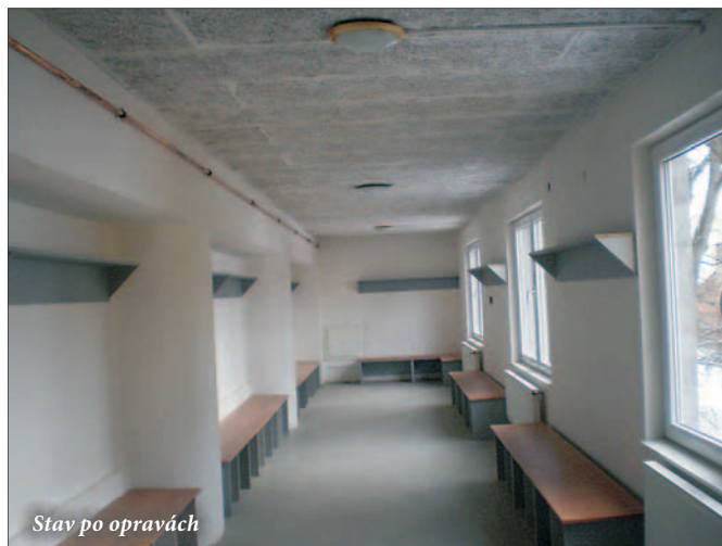
Stav po opravách