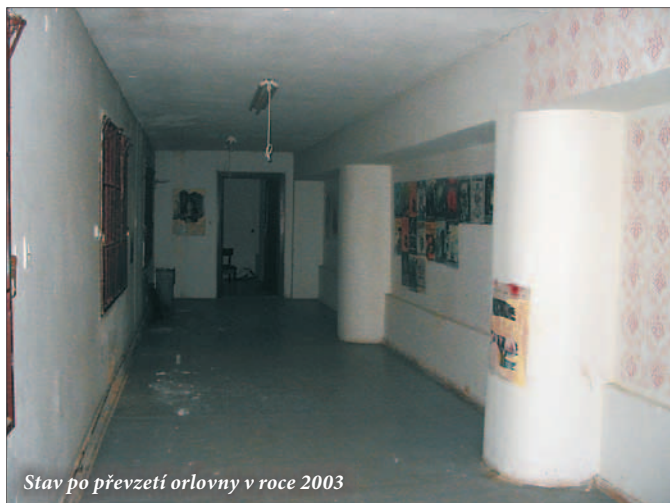
Stav po převzetí orlovnny v roce 2003

(redakčně zkráceno, příspěvek nemusí vyjadřovat názor redakční rady)