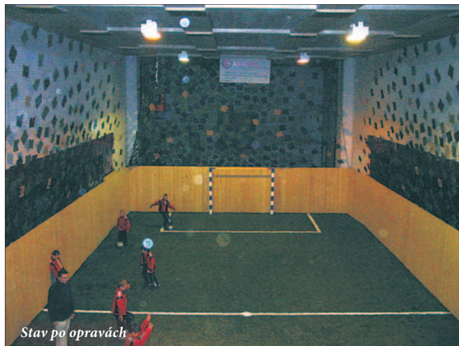
Stav po opravách

dosud podepsaly stovky obyvatel Líšně. Fotbalisté totiž orlovnou v roce 2003 převzali pod svá křídla v době, kdy byl záměr vedení radnice prodat ji trhovcům na sklady. Investovali do ní a pro sportovní účely opravili vnitřní prostory bývalého kina. Využít prostor za objektem, který vždy sloužil sportovcům a sportovkyním je logickým pokračováním výše uvedených snah. Mezi líšeňskou veřejností se také debataje o jiných možnostech využití bývalého hřiště za orlovnou. Jednu z diskusí o problematice budoucnosti orlovnny uspořádalo vedení radnice 5. listopadu. Za SK Líšeň se ho zúčastnil předseda spolku