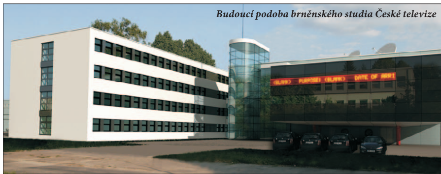
Budoucí podoba brněnského studia České televize

Už v 60. letech minulého století se vedení televize začalo zabývat myšlenkou výstavby budovy pro televizi přímo projektované. Stávající prostory byly totiž v minulosti přebudovány z bytového domu s tančírnou (Jezuitská) a banky (Běhounská). Plány se však stávají skutečností teprve nyní. Pozemek v Brně-Líšni koupila Česká televize před několika lety, nechala zpracovat projekt a letos v září vybrala ve výběrovém řízení zhotovitele stavby, kterým je sdru-