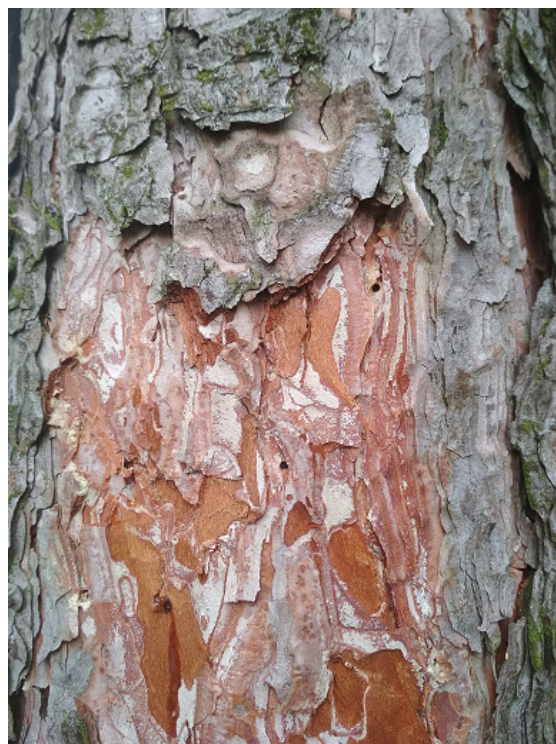
Detail závrťových otvorů napadené borovice