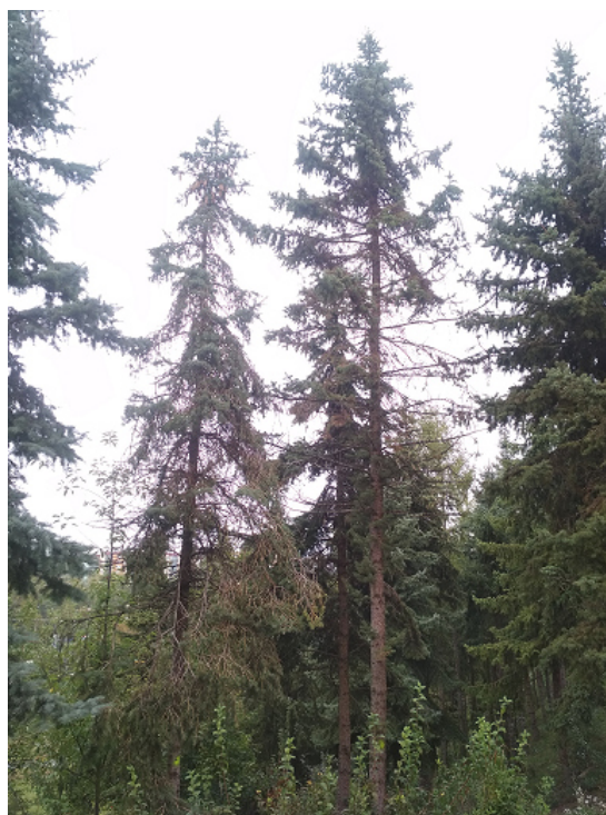
Napadení jednotlivých smrků lýkožrouty