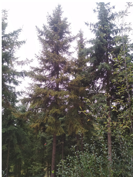
Napadení jednotlivých smrků lýkožrouty