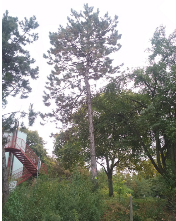
Napadení borovice černé lýkožrouty