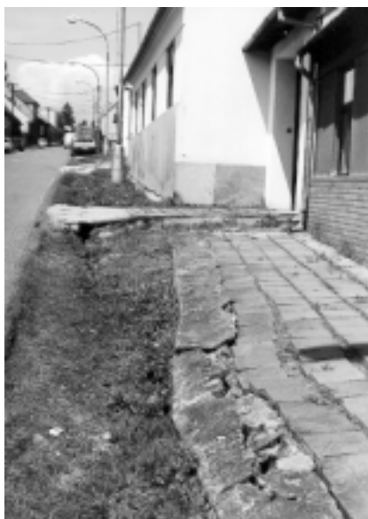
Dnes již archivní snímky ulice Ondráčkovy (foto nahoře) a Trnkovy (foto dole) před vybudováním nové kanalizace.

Výsledkem je dílo, na které můžeme být právem hrdí. Celková hodnota vybudovaného díla dosahuje cca 800 mil. Kč. Máme zdokumentováno na fotografiích i na videu jak vypadaly ulice ve staré zástavbě před vybudováním kanalizace, kdy v příkopcích se rozlévala nelibě vonící močůvka a po ulicích tekly splašky. Podařilo se nám dílo, které se nepodařilo vyřešit po dlouhá desetiletí našim předchůdcům a zbavili jsme Vás, líšeňské občany, tohoto problému. Výrazným způsobem se zvedla kultura bydlení ve staré zástavbě. Samozřejmě, že nám ještě zůstaly k řešení některé nedodělky, které z nějakých důvodů nemohly být zařazeny do tohoto projektu. Mám tím na mysli např. dolní část ulice Ondráčkovy, ulici Kučerovu, Brejtcetlovu a Bodlákovu.