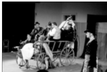
Závěrečná scéna inscenace „Paramisa“.