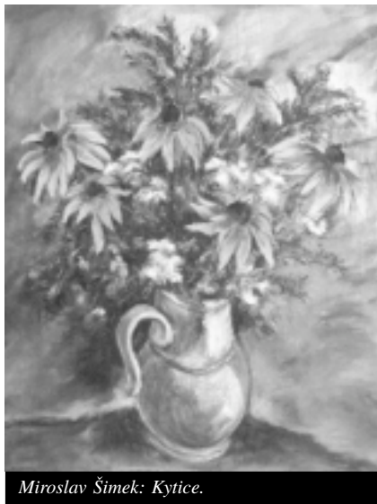
Miroslav Šimek: Kytice.