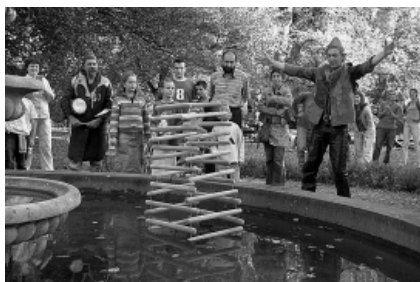
Het Bedrijf v/h.

Byli jsme spokojeni. Holandské Muzeum fantazie (výstava tak trochu ve skálovském duchu a na ni navazující performance, která rozehrála téma pramenů fantazie) přilákala zaslouženě tolik diváků, že jsme se společně s Holanďany rozhodli pro předem nenaplánovanou reprízu o den později. Láká nás přivážet do Brna zajímavé zahraniční soubory, které potkáme na svých cestách po evropských festivalech. A byli jsme rádi, že se Het Bedrijf tady líbil stejně jako kdysi nám, když jsme je potkali na malém nádvoří v Gentu.