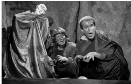
D-dílna Studia Dům a jejich „Krvák“.

Zpráva první: Byl krásný víkend na sklonku babího léta, kdy počasí přálo nejen venkovním produkcím, ale i guláší vařenému a podávanému pod širým nebem. I když se na poslední chvíli zjistilo, že pověstný režisérský kotel na vaření festivalových pozdních obědů a večerů nenávratně zmizel, podařilo se komusi zázračně vytelefonovat nový a zachránit tak pověst festivalu.