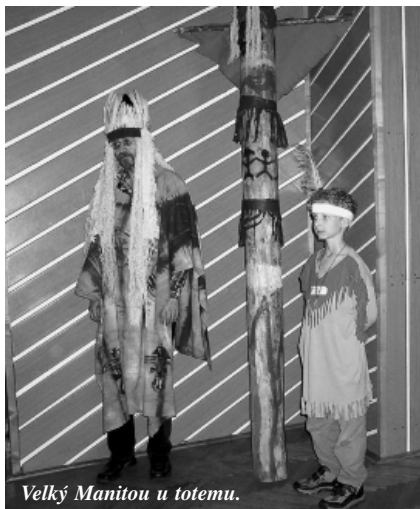
Velký Manitou u totemu.

Počasi tentokrát tradičnímu táboru Hudební školy YAMAHA nepřálo, ale i tak se děti z brněnských poboček školy a ze Šlapanic v druhém týdnu srpna v nádherném prostředí rekreačního střediska v Kosovu u Zábřehu na Moravě skvěle bavily. Letošní indiánské téma bylo inspirativní, takže kromě mne nechyběl ani šaman, totem, tee-pee... Program byl bohatý (mj. z Brna přijel soubor brazilského bojového tance Capoiara, jehož vystoupení tábormníci nejen doprovodili zpěvem, ale aktivně se zapojili a naučili se některé hry). Jako vždy se dopoledne hrálo (kytara, elektrická kytara, zobcová flétna, keyboard) a v rámci oboru pop zpěv i zpívalo. Na závěr připoují dva z mnoha dopisů, které mi malí indiáni napsali.