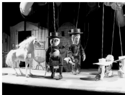
Buchty a loutky – Sedum statečných

17.30 – Buchty a loutky: Sedum statečných. Adios amigos. Adios amores. Hasta la vista. Hasta Manana. Loutkový barevný širokoúhlý western velmi volně na motivy stejnojmenného barevného amerického filmu. (Omezený počet míst.)