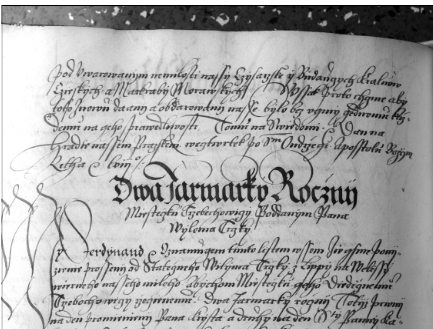
Národní archiv, Salbuch, č. 286, folio 153v s koncem textu privilegia (s datovací formulí).