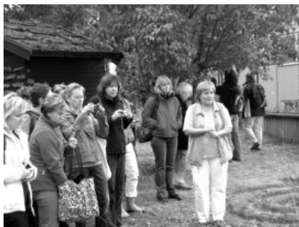
Ekologické setkání Jižní Moravy

Celý kolektiv mateřské školy se stal o občerstvení jak pro děti, tak dospělé. Podávaly se teplé ovocné koláče, bábovky, káva, čaj, minerálky. Počasí nám velice přálo a tak se vydařil i táborák s opékáním špekáčků. Rodiče vedli příjemnou konverzaci a tak se hned na začátku školního roku navzájem poznávali.