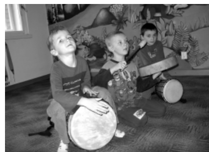
Kurz rytmohrátky – malí bublenici

Pozor: možnost vyrobit si LAMPIONEK vlastní, budete mít dva čtvrtky před konáním akce tedy 5. a 12. 11. od 17.30 hod. v Pastelce.