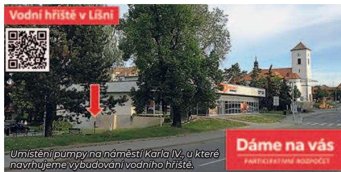
Umístění pumpy na náměstí Karla IV., u které navrhujeme vybudování vodního hřiště.

v květnu 2022 provést, navíc ukázaly, že voda z veřejných studní v Líšni zdaleka nesplňuje parametry pro vodu pitnou – nelze ji tedy využít ani jako zdroj vody pro případné pitko.