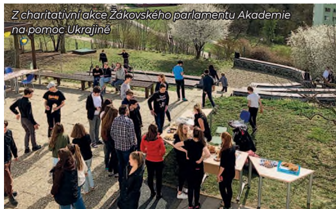
Z charitativní akce Žakovského parlamentu Akademie na pomoc Ukrajině

Základem naší filozofie je individuální přístup k žákům a nabídka kvalitního všeobecného vzdělávání pod heslem „vstřícná náročnost“. V mateřské škole máme sedmáct dětí, ve třídách prvostup-