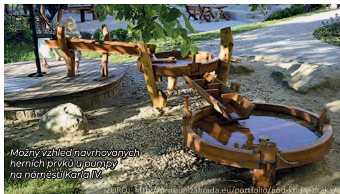
Možný vzhled navrhovaných herních prvků u pumpy na náměstí Karla IV.

Přestože městská část Líšeň v uplynulém roce nechala opravit 8 pump a další 4 plánuje opravit v roce letošním, této pumpu v samém centru Staré Líšně se to netýkalo. Důvody jsou celkem pochopitelné. K opravám byly vybrány převážně takové studny, které jsou místními používány na závlaku zahrádek, což není případ pumpu na náměstí. Rozbory vody, které městská část nechala