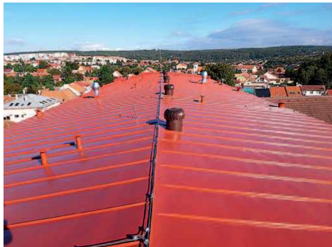
Opravená střecha je nově osazena bezpečnostními prvky, výlezem i větracími hlavicemi