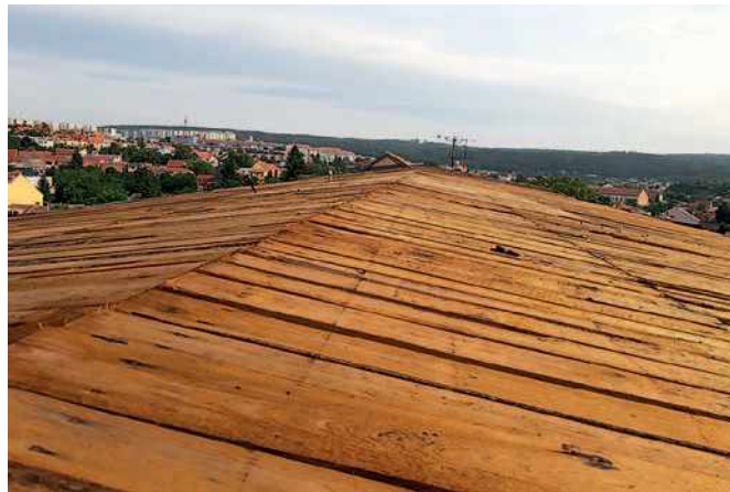
Střecha před opravou