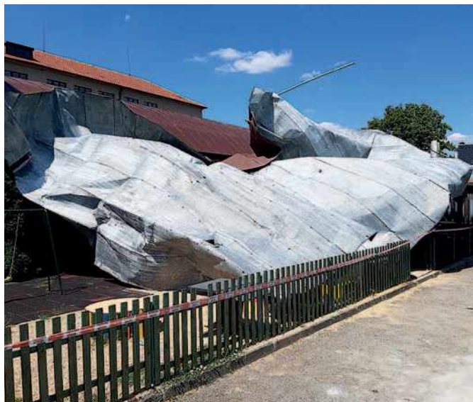
Plechová krytina ZŠ Holzova po víchřici odlétla na fotbalový stadion SK Líšeň