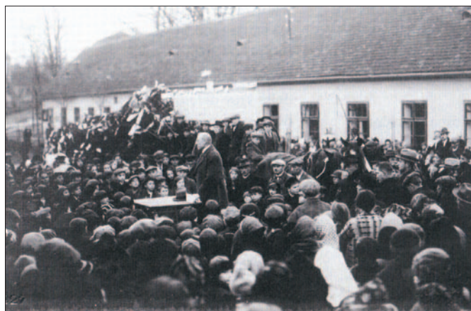
Rozloučení se stromem v Líšni 6. prosince 1927: uprostřed hovoří redaktor Těsnohlídka.

V pořadí čtvrtý vánoční strom pro Brno byl přivezen z Líšně v roce 1927. Věnovalo jej ředitelství Belcrediho statku v Líšni (z obcí u Ochoze). Slavnostní rozloučení se stromem se uskutečnilo v Líšni 6. prosince a předán byl brněnské veřejnosti 10. prosince 1927. Vybraná částka pod stromem činila 50.323 Kč, naturální dary měly hodnotu 5.818 Kč.