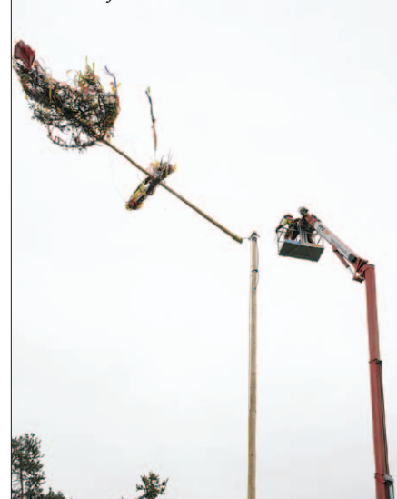
Kácení máje 14. 10. 2016

Snad i Vám „cimbalclassická komořinka“ učaruje a vtáhne Vás do svého laskavého světa.