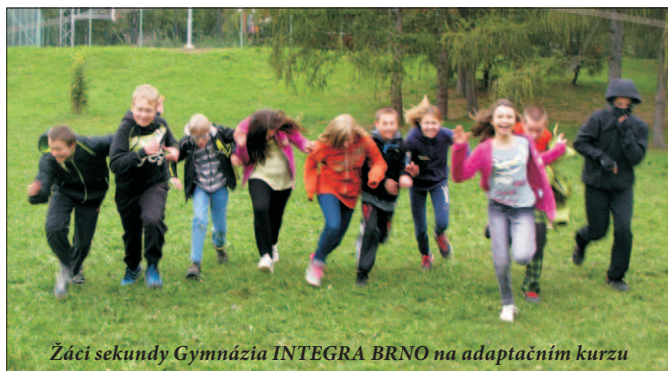
Žáci sekundy Gymnázia INTEGRA BRNO na adaptačním kurzu

Gymnázium INTEGRA BRNO se každoročně otevírá zájemcům o studium i široké veřejnosti. Využijte proto i vy naši nabídky a přijďte nahlédnout do zákulisí střední školy, která je v naší městské části už dvacet let. Poprvé také budete moci nahlédnout do prostor nové „Naší školky“ při gymnáziu, která nabízí nadstandardní péči pro naše nejmenší.