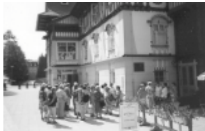
Zájezd klubu důchodců do Luhačovic.

Plavání – každý pátek – první skupina od 17.00 do 18.00 hodin, druhá od 18.00 do 19.00 hodin.