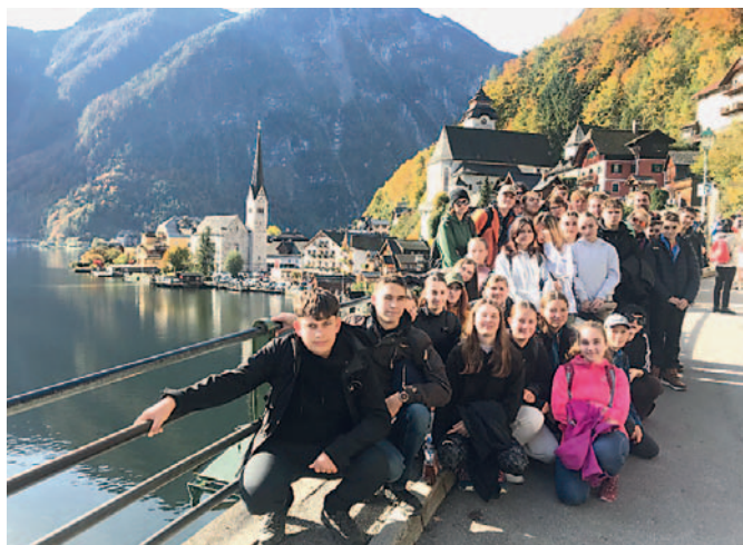
Žáci Gymnázia AKADEMIA na exkurzi v rakouském Hallstattu.

Pro zájemce z vyšších ročníků jsme připravili atraktivní zájezd do rakouského Solnohradska. Navštívili jsme Salzburg s nově zrekonstruovaným rodným domem W. A. Mozarta, prošli staré město s jeho kostely a vyjeli lanovkou nad město prohlédnout si středověké sídlo arcibiskupů – pevnost Hohensalzburg. I další dny byly nabitě programem – následoval rychlý přejezd na německou stranu, do solných dolů v Berchtesgadenu, kde všechny nadchla jízda na dřevěných kládách ve stylu Pyšné princezny, poté výjezd na nechvalně proslulé Hitlerovo Orlí hnízdo a v závěru dne romantická projížďka po jezeře Königssee. Třetí den patřil opět Rakousku – půvabnému městečku Hallstatt s jeho bohatou historií. Celý zájezd pak završil výjezd lanovkou na proslulý Dachstein a výšlap na vyhlídku Pět prstů.