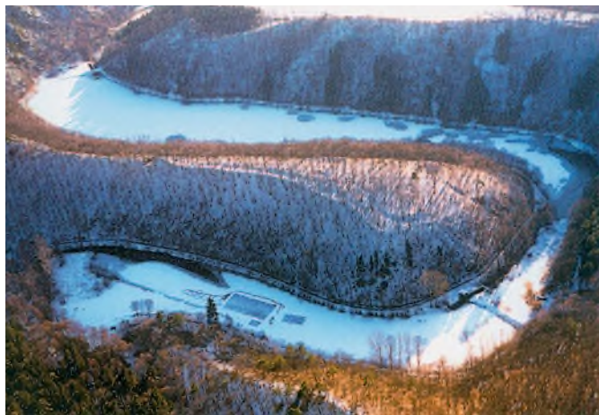
Letecký pohled na Horákovský hrad v zimě.

Nedoporučujeme ale čtenářům následovat pasáčka a hledat ve zříceninách Horákovského hradu (též zvaného Hrádek) poklady. Jednak podle jiné pověsti tajemství Horákovského hradu chrání velký pes s ohnivými očima, jednak takové výkopy náleží odborníkům – archeologům. Díky jejich výzkumům víme, že ve skutečnosti na této ostrožně nad meandrem Říčky bylo pravěké a raně středověké opevněné hradisko, ve vrcholném středověku pak hospodářský dvůr (viz současnou informační tabuli na místě). Lidový název „hrad“ měl vzniknout díky nápadným zbytkům dávného opevnění. Je však pravda, že na základě zprávy z roku 1464 zde někteří badatelé přítomnost hradu připouštěli.