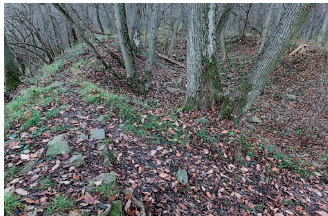
Po údajném hradu zůstaly dnes jen hromady kamení.