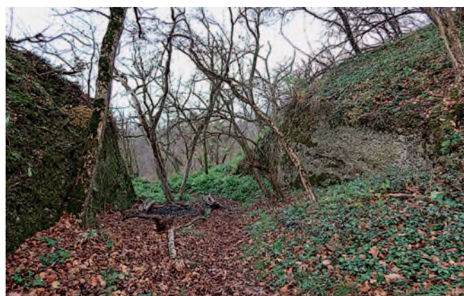
Příkop vytesaný ve slepencích.