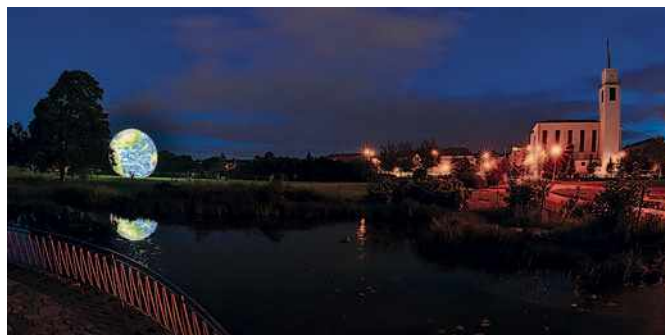
Jiří Sláma: Uzemnění na Kraví hoře

máme skvělé podmínky. Tady si ukazujeme fotky a diskutujeme. Každý rok máme tři až čtyři klubové výstavy v různých místech Moravy a zúčastňujeme korespondenčních meziklubových soutěží Mapové okruhy, kde si patnáct klubů z celé republiky vzájemně posílá a hodnotí fotografie. Pak je z toho velká společná výstava.