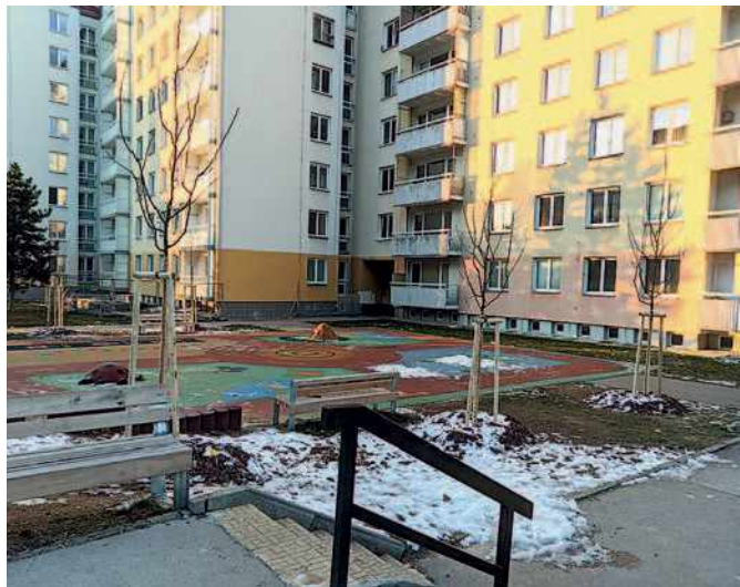
Nové stromy Strnadova – Štefáčkova

Mnoho stromů a keřů, jako jsou javory babyky, habry, trnky, dřín, kaliny, brsleny nebo ptačí zob, jsme vysadili i podél ulice Jedovnická a Podruhova , kde budou vytvářet zelenou barieru proti hluku a prachu ze silnice. A v prostoru pod parkovišti dokonce vznikne malý mandloňový sad. Věřím, že v době květu nám dá stejnou krásu a potěšení jako např. slavné mandloňové sady u Hustopečí. Stromy a keře v této lokalitě také poskytnou potravu ptákům, ale i lidem, protože mnohé z nich budou jedlé. V prostoru mezi Trnkovou a J. Faimonové provedl náhradní výsadbu developer stavící