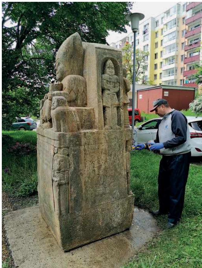
Kašpárek před MŠ Synkova, autor Alois Mikulka

z doby výstavby sídliště. V příštím roce v této aktivitě budeme pokračovat. Pokud máte pocit, že se na nějaké místo dlouho zapomíná, prosím, pošlete mi zprávu. Děkuji.