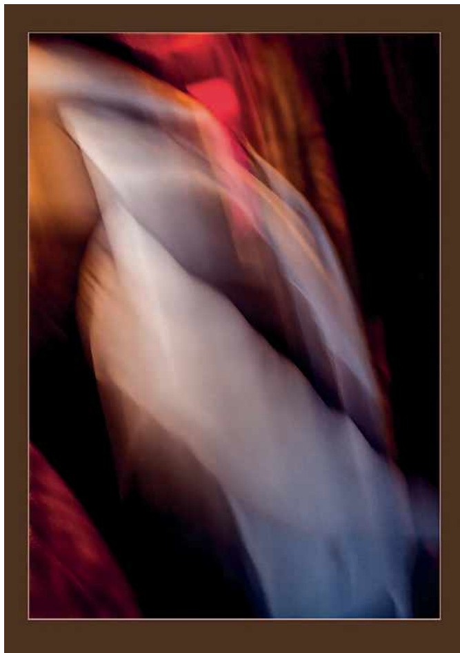
Boris Filemon: Vášeň

Scházíme se pravidelně každé dva týdny a nové členy v souladu se stanovami přibíráme. Naše zázemí je na brněnské hvězdárně, kde