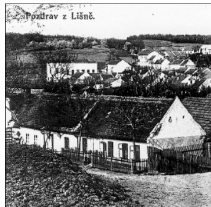
Výřez z pohlednice z roku 1916 (fotografováno na začátku Salajní ulice, v popředí typické líšeňské domky).

V síni je též schodiště na hůru nad obydlím. Hůra je buď vydlážděna „tihlama“, nebo je tam „mazanica“ (upěchovaná hlína), aby neprohořelo. Hůra slouží také za sýpku obilní. (pokračování příště)