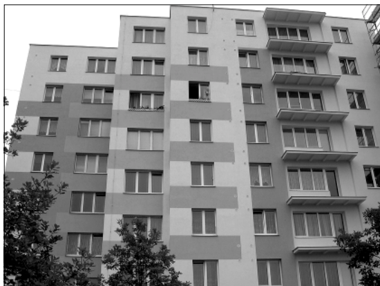
Nová tvář domů na Masarově ulici.

Mgr. Jiří Janišťin starosta MČ Brno-Líšeň