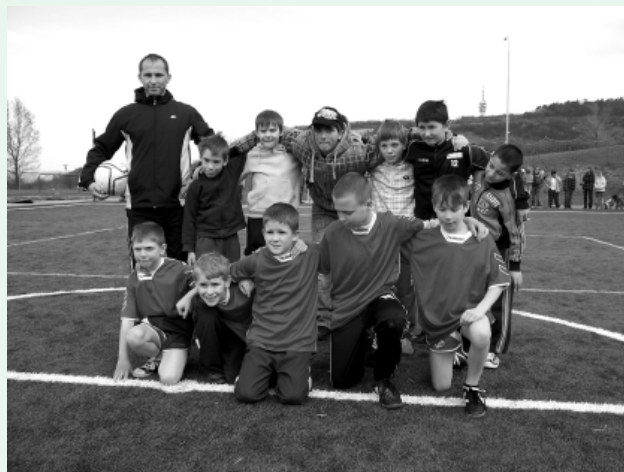
Ve fotbalovém utkání si s žáky školy poměřily svoje síly i děti z líšeňského Klokánku.

Národopisný soubor Líšňáci Vás srdečně zve na