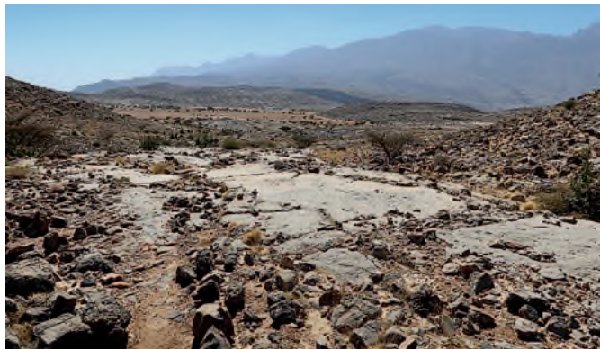
Archeologické naleziště (světlá deprese se stromy v pozadí) je ukryto hluboko v pohoří Al-Hajar.