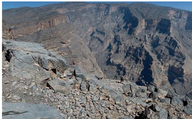
Nad arabským Grand kaňonem.