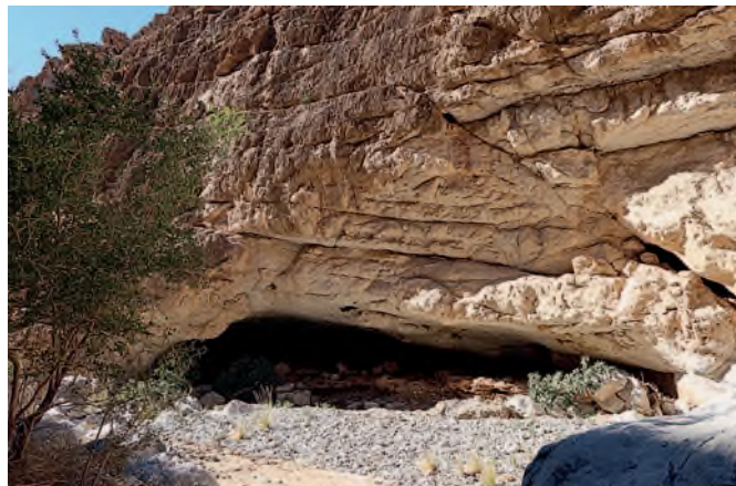
Objevená jeskyně nazvaná Pekárna, pohled ke vchodu.

vícekrát, a to jak ve starší tak i v mladší době kamenné. Pro přesnější zařazení pravěkého osídlení této krasové deprese jsme provedli do její sedimentární výplně 11 ručních vrtů a vykopali několik sond, ze kterých byly odebrány vzorky na různé typy absolutního datování a bádání o dávném klimatu. Při dokumentaci okolních vádí jsme našli několik jeskyní, z nichž jedna se neuvěřitelně podobá Pekárně u obce Ochoz, proto dostala stejný název.