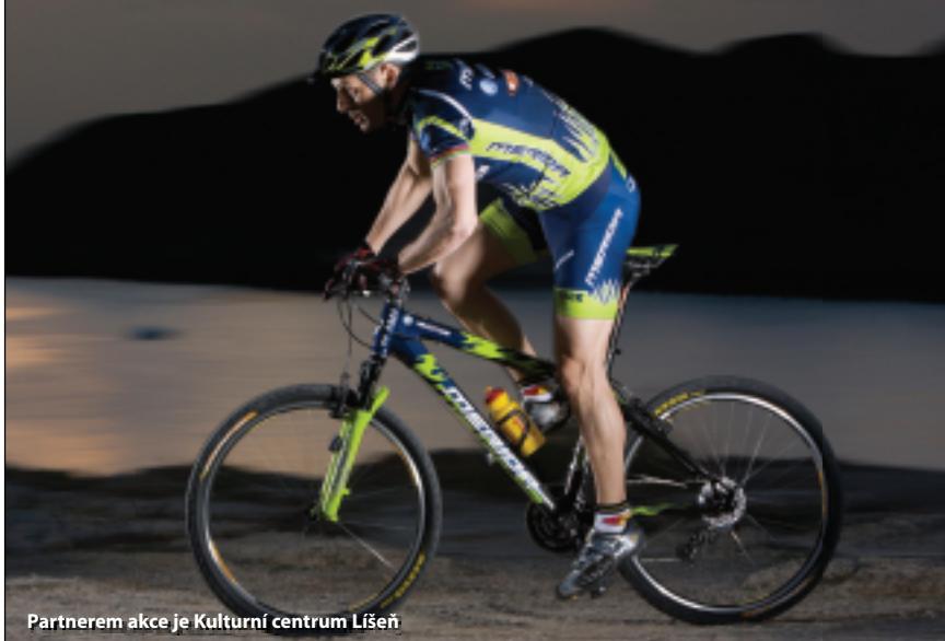
Partnerem akce je Kulturní centrum Líšeň

Každý může Mariánský okruh pojmout po svém, někdo jako závod, jiný jako vyjíždku, ale především jde o protáhnutí těla a hezký sportovní zážitek.