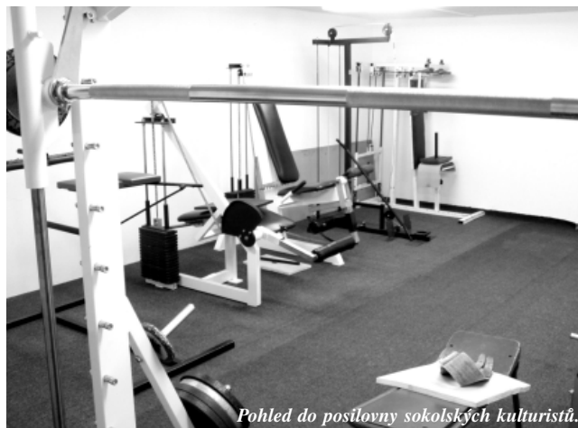
Pohled do posilovny sokolských kulturistů.