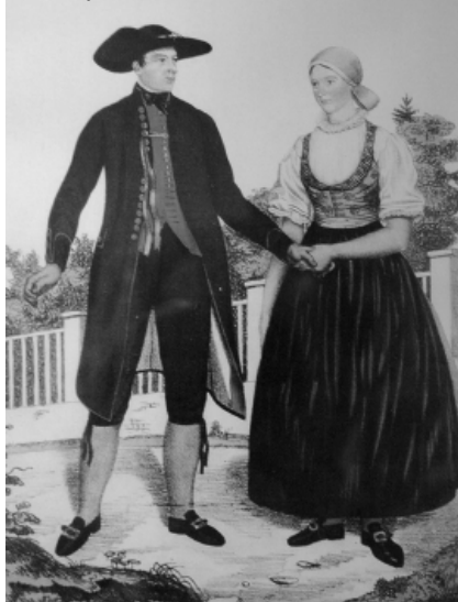
Nejstarší vyobrazení líšeňského kroje od Wilhelma Horna z roku 1837.

vé), kabáty dlouhé až po paty s velkými knoflíky kovovými. Límce u kabátů byly vysoké, tlusté a tuhé. Na krk byl šátek hedvábný černý nebo bílý, na hlavu širák, beranice, vydrovka, aksamitka. Na zimu měli pláště se sedmi nebo devíti límci, na všední den halenu opásanou povříselem.