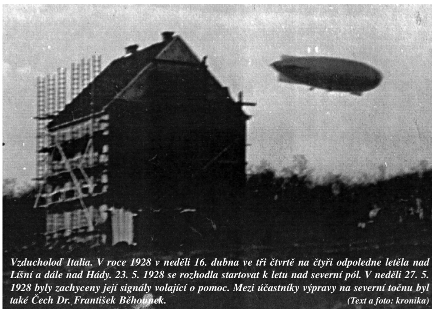
Vzducholoď Italia. V roce 1928 v neděli 16. dubna ve tři čtvrtě na čtyři odpoledne letěla nad Líšní a dále nad Hády. 23. 5. 1928 se rozhodla startovat k letu nad severní pól. V neděli 27. 5. 1928 byly zachyceny její signály volající o pomoc. Mezi účastníky výpravy na severní točnu byl také Čech Dr. František Běhounek.

nebo na tel.: 544 210 182 a 731 117 114.