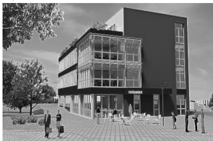
Bytový dům – objekt SO 03.

Administrativně obchodní centrum Líšeň – objekt SO 02.