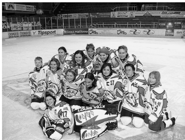
Dívčí tým HLC Bulldogs se letos proboujel z moravské skupiny ženské hokejové ligy do celostátního finále, kde obsadil vynikající třetí místo.

Podrobnější informace mohou zájemci získat na internetové adrese www.hlcbulldogs.cz .