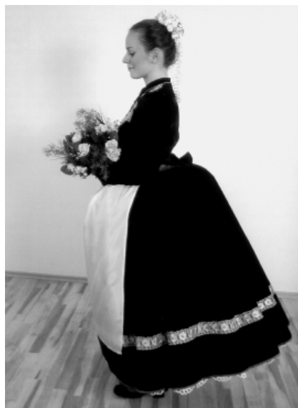
Nevěsta v plyšovém obleku. Fotografie Renaty Lorencové z knihy „Lidový kroj v Brně-Lišni“ (Josef Trávníček, 2006).

A dež vodzpívávoj, zatřepe s nima, že só hned na hromadě. Dež vodcházíjo hosti, lóčíjo se a zpívájo: