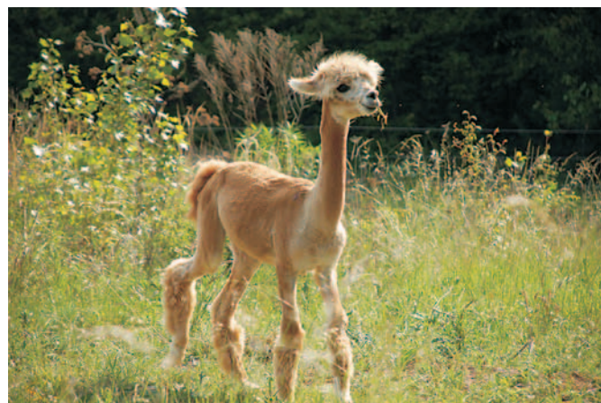
Mládě lamy – Řiša