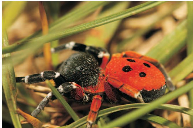
Stepník moravský (alias Stepník rudý)

Územní ochrana Hádu je plošně poměrně rozsáhlá. Nacházejí se zde tři zvláště chráněná území o rozloze cca 1 km 2 – národní přírodní rezervace Hádecká planinka, přírodní památka Kavky a přírodní památka Velká Klajdovka. Udržovat takové území není lehký úkol a zapojit se určitě mohou i dobrovolníci. PSH tyto lokality pravidelně seče či odstraňuje výmladky náletových dřevin. Tato péče je velice