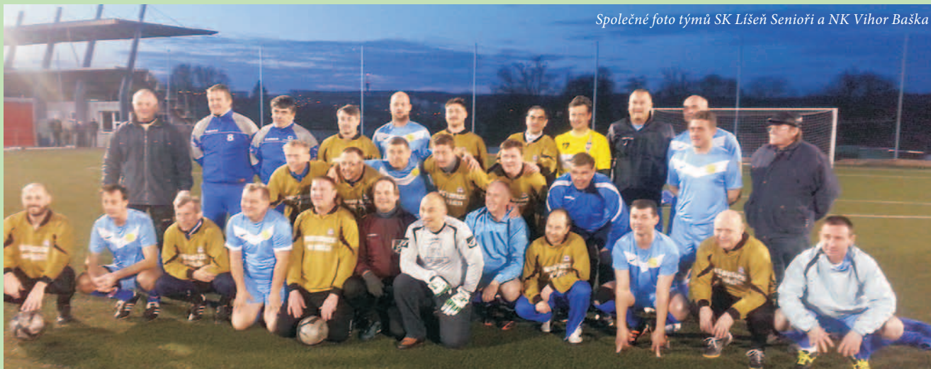
Společné foto týmů SK Líšeň Senioři a NK Vihor Baška