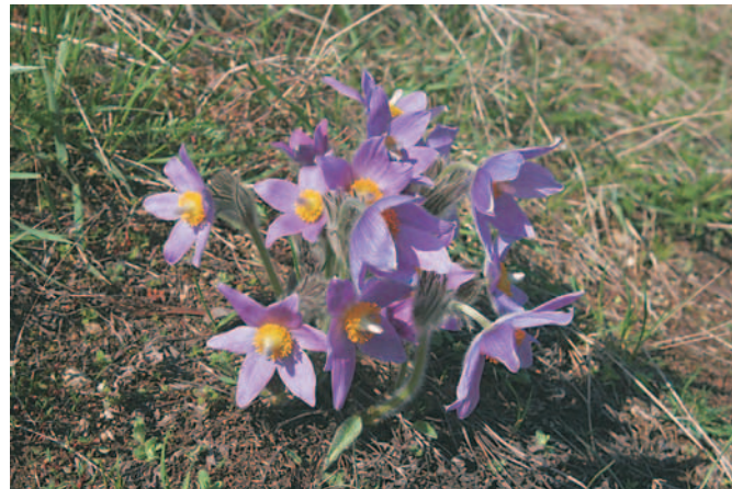
Koniklec velkokvětý

plochy jsou atraktivní pro mnohé druhy bezobratlých. Při troše štěstí zde můžeme potkat třeba kudlanku nábožnou, či malinkého, avšak velmi vzácného červeného pavoučka stepníka rudého. V hromadách klestí nebo kamení nachází svůj nový domov ještěrka zelená či užovka hladká. Jezírka Růženina lomu mají trochu odlišné obyvatele.