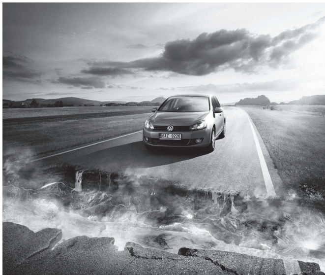
Akce trvá do 31. 5. 2012. Kombinovaná spotřeba a emise CO 2 : 4,5–5,8 l/100 km, 119–134 g/km. Vyobrazený vůz může obsahovat prvky příplatkové výbavy.